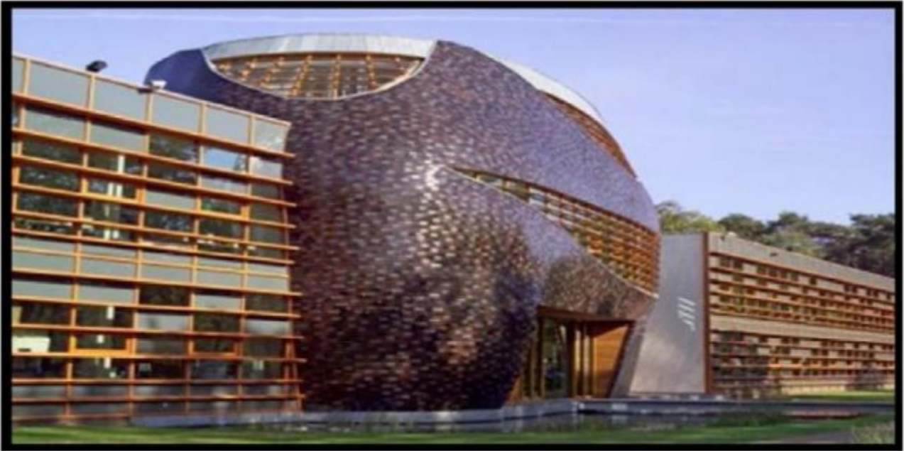
Bild 3. Wenn Sie wieder jemand im Pandakostüm um eine milde Gabe bittet: World Wildlife Fund Headquarters in Zeist