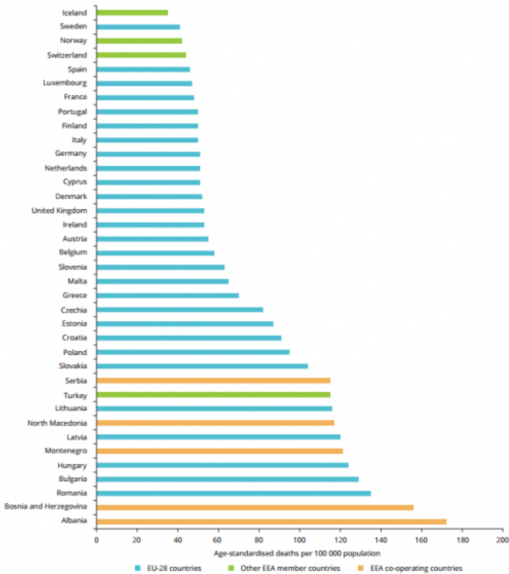
Figure 2.1 Age-standardised deaths attributable to the environment in the EEA-39 countries, per 100 000 people, 2012

Bild 2 [1] Tabelle: Prozentualer Anteil von Gestorbenen aufgrund von Umwelteinflüssen einzelner Länder (Stand 2012)