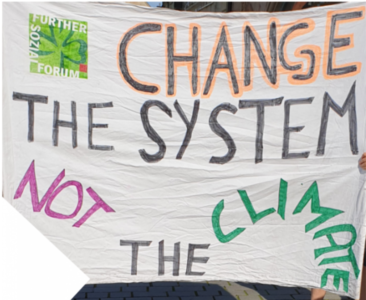
Bild 7 Forderung von Parents for Future. Foto vom Autor von einer lokalen Veranstaltung

Altmaier bekundet damit offiziell, dass sich nun auch seine Partei endgültig dem Diktat von Merkel und der Straße beugte.