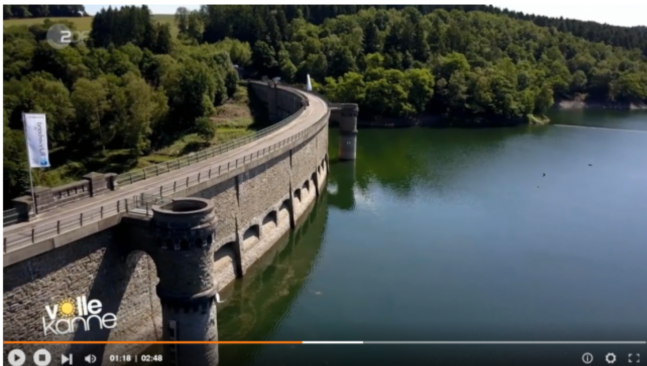
Bild 1 [1] Ennepetal-Talsperre in Nordrhein-Westfalen. (Screenshot) aus dem kurzen Video

... noch nicht, aber es könnte so kommen. Denn schon Hagel und Starkregen beschädigen die sensiblen Wände solcher Bauten – zumindest wenn es sich um uralte Stauwehre in Deutschland handelt – wie es das ZDF im Video [1] berichtet.