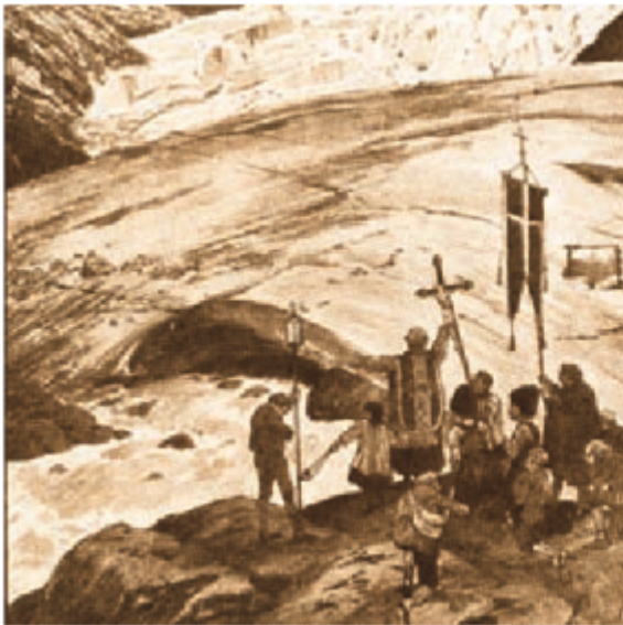
GletscherprozeSSIONen (hier Mittelbergferner/Pitztal um 1870)) und Fürbitten sollten vor Ausbrüchen von rückgestautem Gletscherwasser schützen.

Die Gefahr großer Überschwemmungen durch Gletscherseen ist nicht neu. Aus der Zeit vor dem „Klimawandel“ gibt es viele Berichte, worin überlaufende Gletscher-Seen – teils sogar regelmäßig – die Täler und darin die Dörfer überschwemmten [3]. Es ist eines der Probleme, welche Bergbewohner schon immer hatten und durch die teils extreme Besiedlungsdichte der Alpentäler nur noch viel schlimmer geworden ist.