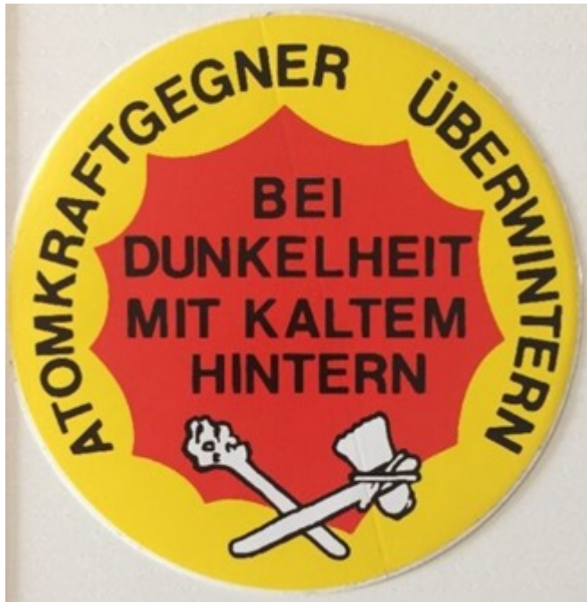
Abb.4: Zur verteufelten Kernenergie hat sich mittlerweile die Energie aus fossilen Energieträgern gesellt. Die Steinzeit rückt somit immer näher.

Eine verfehlte Energiepolitik vernichtet hunderttausende Arbeitsplätze, weil durch die teure Energie Industrie und Wirtschaft nicht mehr in Deutschland produzieren können, da deren Produkte dadurch immer teurer werden und nicht mehr wettbewerbsfähig sind. So liegt in Schlüsselindustrien der Energiekostenanteil bei 10% und mehr. Nicht umsonst baut China* in seiner Planung bis 2020, nein, nicht die Erneuerbaren Energie aus, sondern billig erzeugte Energien aus Kohle- und Kernkraft.