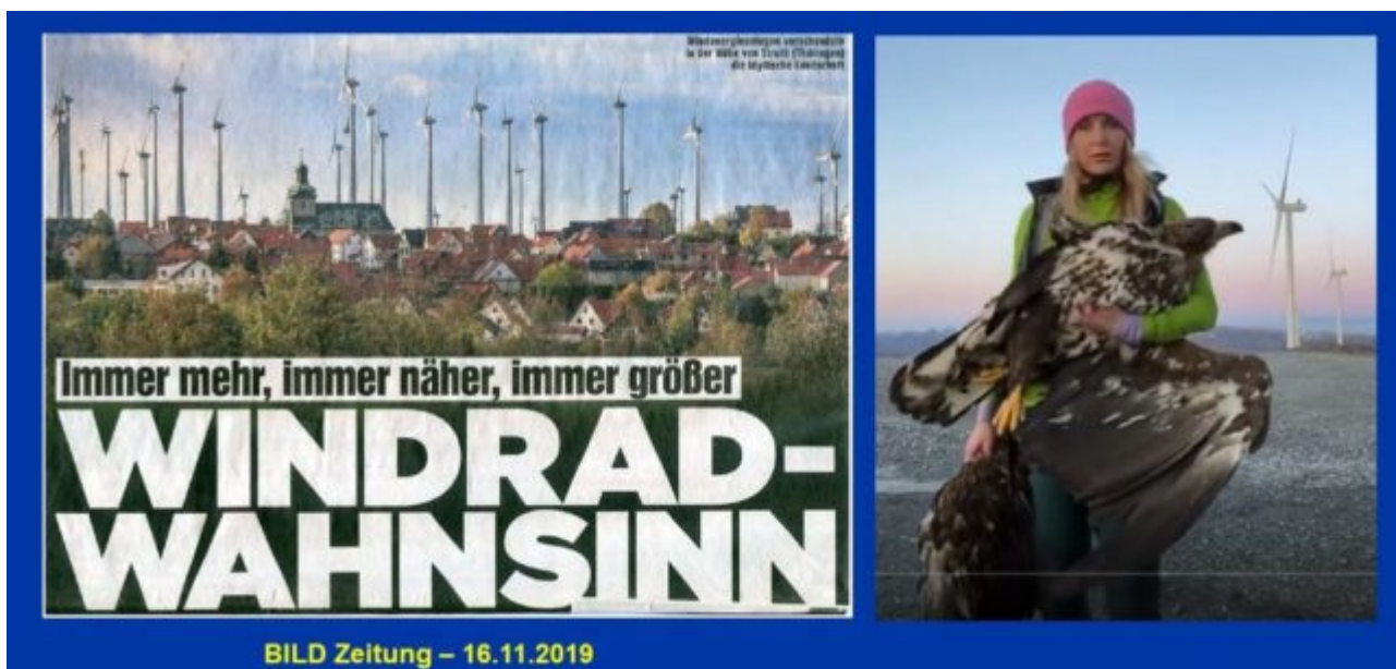
Abbildung 4: Links: Windkraftanlagen in der Nähe von Struth (Thüringen) verschandeln die idyllische Landschaft Rechts: von einem Windrad getöteter Greifvogel

Schattenwurf, Infra-Schall, Vogel-, Fledermaus- und Insektenschlag, Raubbau an der Natur und Verschandelung der Landschaft (Abbildung 4) sind die bekanntesten Argumente gegen Windkraftanlagen. Kaum bekannt hingegen ist der Dürre-Effekt der Windräder. Er entsteht infolge der atmosphärischen Verwirbelung durch die Turbinenblätter.