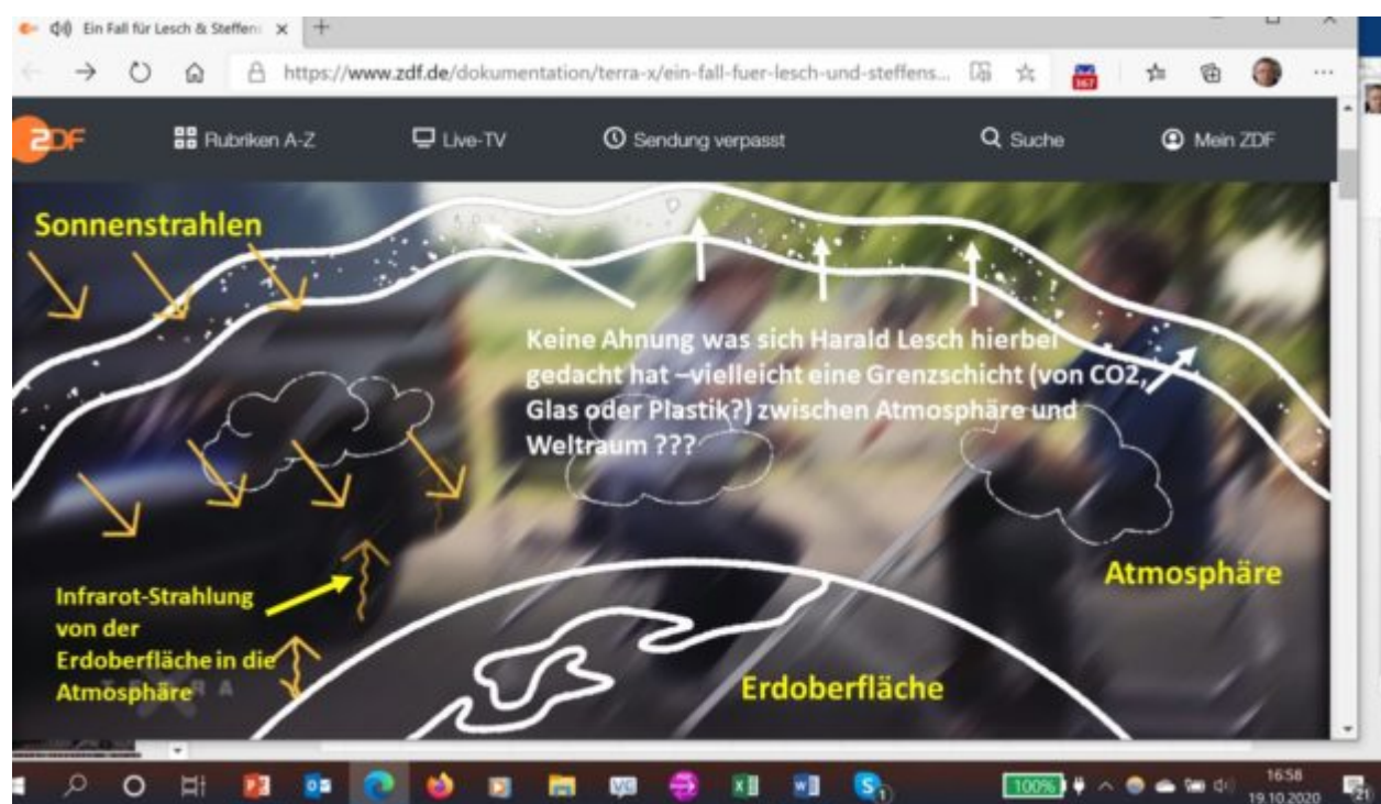
Abb. 3: Screenshot aus der Terra-X Sendung vom 18.10.2020 im ZDF

„Harald Lesch präsentierte das nachfolgende Schema von der Erdatmosphäre (Abbildung 3). Mich wundert dabei, was er unter der Doppelschicht versteht, welche in seiner Abbildung die Erdatmosphäre zum Weltall hin begrenzt. Anscheinend ist Lesch der Meinung, unsere Atmosphäre sei von einer Trennschicht umgeben (aus \text{CO}_2 oder aus was?), denn seine Dose, welche die Erdatmosphäre repräsentieren soll, stellt ein geschlossenes System dar. Für den Fall, dass es sich unter Klima-Alarmisten noch nicht herumgesprochen haben soll: Die Erdatmosphäre ist zum Weltraum hin offen!“