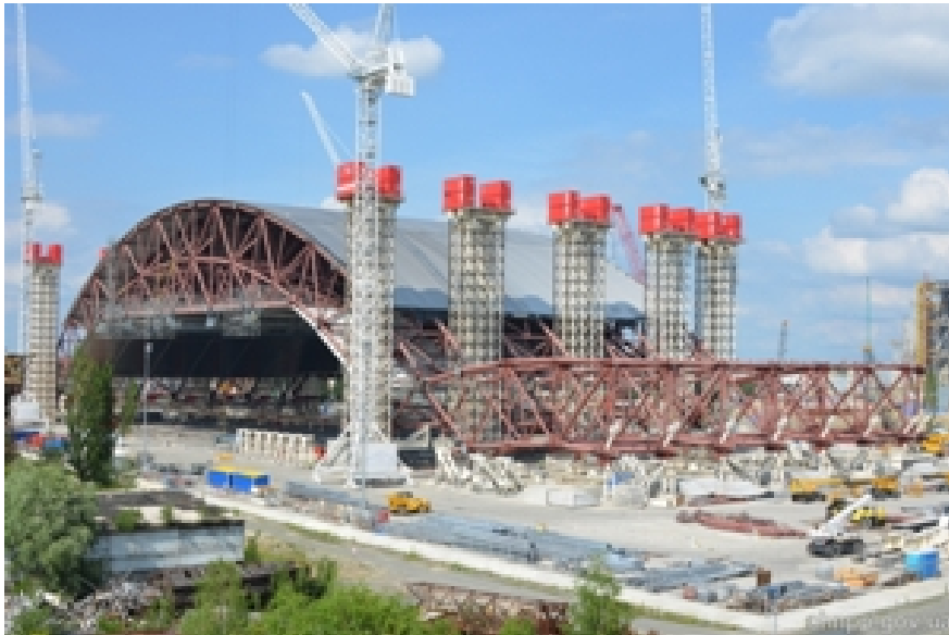
„Sarkophag“ KKW Tschernobyl Juni 2013

Die Maße der Konstruktion 105m hoch, 150m lang, 257m Spannweite, das Gewicht 29 000 t ( = dreifaches Gewicht vom Eiffelturm). Natürlich waren dort sehr viele Menschen beschäftigt. Die Kosten für diesen zweiten Sarkophag betragen schon über 2 Mrd. EURO.