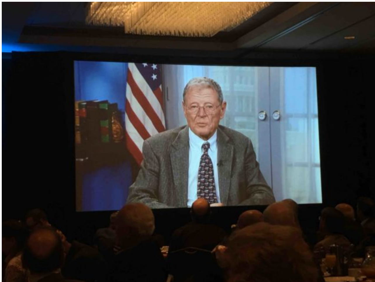
US Senator James Inhofe, bei seiner Begrüßungsrede anlässlich der 12. Heartland Klimakonferenz in Washington DC.

Den Auftakt machte ein Video-Grußwort des politischen Anführers der Klimarealisten im US Kongress, Senator James Inhofe, der ausführte, dass nun die Zeit gekommen sei, die gesetzlichen Vorgaben, sei es durch die Umweltbehörde EPA verfügte, oder durch präsidiale Erlasse von Präsident Obama aufzuheben, weil die überaus teuren, für das Klima aber völlig wirkungslosen, mithin für die Bevölkerung und das Land nutzlosen Gesetze und Verordnungen, das Vertrauen zwischen Regierung und Regierten völlig zerstört hätten. Diese Vertrauen wieder herzustellen, sei die große Aufgabe der Regierung Trump.