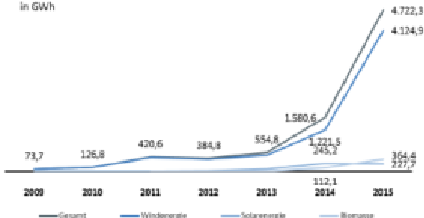
Abbildung 41: Ausfallarbeit verursacht durch EinsMan-Maßnahmen

Abbildung 1 und 2: Aus dem Monitoringbericht Energie der Bundesnetzagentur/Bundeskartellamt links Seite 99, rechts Seite 105. Mit Dank an R. Schuster für den Hinweis