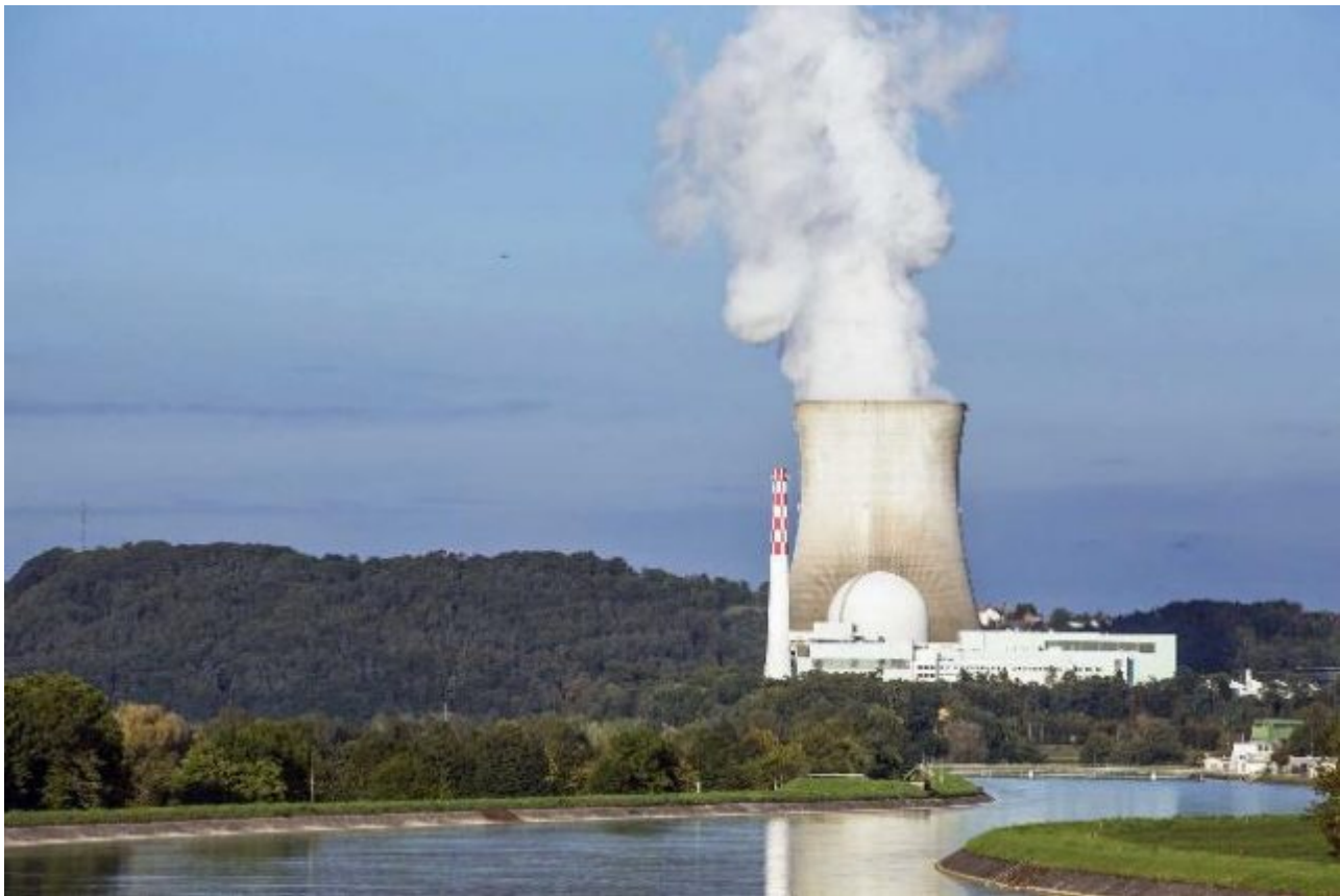
Bild 5. Kernkraftwerke gelten den meisten Journalisten als Höllenmaschinen

Teile der SPD (Schröder) als „Rechts“ statt als „Mitte“, verorteten Grüne und Jusos als „Mitte“ und vertreten darüber hinaus zu erheblichen Teilen linksradikale und sogar extremistische Positionen. Dies zeigt sich an oft extrem einseitigen Berichterstattungen zahlreicher Medien über die Fridays for Future, die Besetzungen des Hambacher Forstes und von Tagebauen in der Lausitz sowie über die Fast-schon-Terroristen von Extinction Rebellion. Vom Ausland aus betrachtet wird dies viel klarer gesehen als im Inland, wo eine Journalistenkrähe offenkundig der anderen kein Auge aushackt. So stellt ein Bericht in der „Neue Zürcher Zeitung“ mit dem Titel „ Das Herz des deutschen Journalisten schlägt links “ fest, dass neutraler Journalismus (in Deutschland) eine Illusion sein dürfte. Ebenso kritisch liest sich der Beitrag „ Grün ist die Redaktion – die deutschen Mainstream-Medien haben aus der Flüchtlingskrise nichts gelernt. “