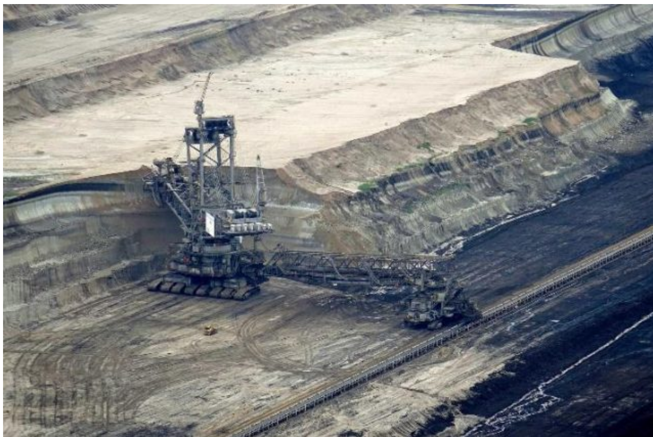
Bild 4. Vom Wahrzeichen der Daseinsvorsorge zum Hasssymbol vieler Journalisten: Ein Braunkohlebagger