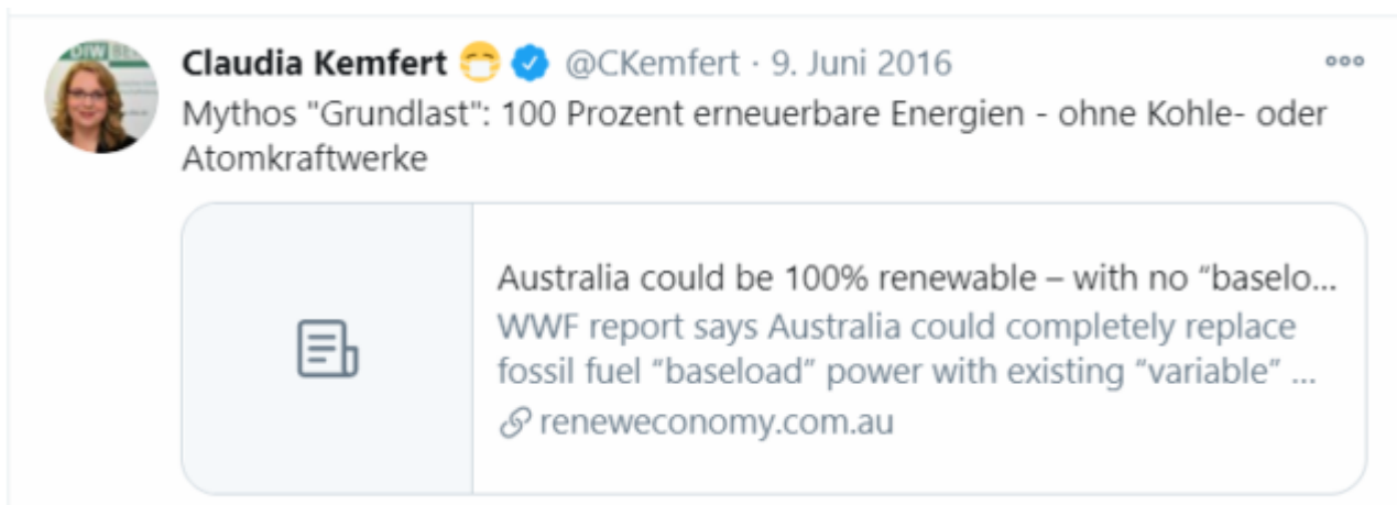
Bild 4 C. Kemfert Tweet

Man muss der C. Kemfert allerdings zugute halten, dass sie wirkliche Lösungen weiß. Zu ihrer These, dass Grundlast im Ökonetz nicht mehr erforderlich ist, nennt sie auch die Lösung: Wenn kein Strom da ist, gilt das „Prinzip Afrika“: Gibt es keinen Strom im Netz, kommt eben auch keiner aus der Steckdose. In einem High-Tech-Land wie unserem wird dem Mangel der dort notgedrungen herrscht allerdings „Intelligenz“ beigemischt und schon wird er ganz modern und zukunftsfähig. Der nicht vorhandene Strom wird nicht einfach nur nicht geliefert, sondern vom „intelligenten Netz“ wie unser Abfall ordentlich per Fernschaltung am Stadtteil- oder Hauseingang fein säuberlich getrennt [3]. So viel Fortschritt muss schon sein.