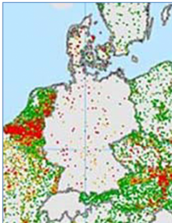
EU-Berichtszeitraum 2004-2007 2008-2011