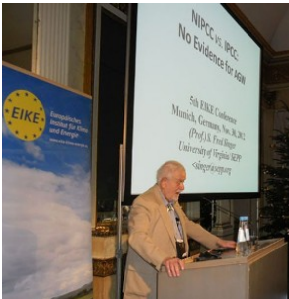
Fred Singer bei der 5. IKEK in München 2012

Weil er sah, dass die aufkommende Umweltbewegung besonders mit der Politik eine für die Demokratie höchst gefährliche Symbiose anstrebte, gründete er bereits 1990 das Science and Environmental Policy Project (SEPP) und 2008 in Wien das Nongovernmental International Panel on Climate Change (NIPCC) . Beide Institutionen waren aktiv in der Gewinnung und Verbreitung wissenschaftlicher Fakten, gegen die zunehmende Ideologisierung der Umweltidee – und der aufkommenden Panikmache wg. des vermeintlich menschengemachten Klimawandels. Eine Fülle von wissenschaftlichen Büchern ( Climate Change Reconsidered , oder Unstoppable Global Warming, Every 1,500 Years , zusammen mit Dennis Avery) und viele Arbeiten, die in dieser fruchtbaren Zeit, vielfach mit Unterstützung von Heartland und Cfact entstanden, legen davon ein beredtes Zeugnis ab.