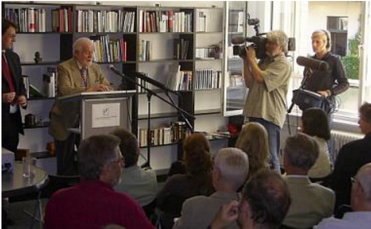
Fred Singer als Redner anlässlich der 1. EIKE Klimakonferenz am 30. Mai 2007

Dr. Singer war Hauptredner auf unserer allerersten Klimakonferenz in Berlin im Jahre 2007 in den Räumen des Instituts für Unternehmerische Freiheit (IUF) am 30.5.2007 unmittelbar nach unserer Gründung. Und hielt uns auch in allen Folgejahren die Treue, auch wenn in den letzten Jahren, seine körperliche Beschaffenheit weite Reisen von seinem Wohnsitz in Virginia USA zunehmend beschwerlicher machten. Doch sein unbändiger Willen, die Wissenschaft nicht zu einem Wasserträger der Politik verkommen zu lassen, was sich besonders in der zunehmenden Vereinnahmung der Umweltwissenschaften durch diese zeigte, erlaubte ihm seinem Körper alles abzuverlangen. Zu unser aller Glück machte der das auch fast 1 ½ Jahrzehnte lang mit. Denn keiner wäre mehr prädestiniert gewesen als er, genau diese Vereinnahmung zu sehen, denn er kam direkt aus der Wissenschaft und wirkte dort immer an herausragender Stelle, wie ein kurzer und auch nur auszugsweiser Blick auf seine außerordentliche Vita zeigt: