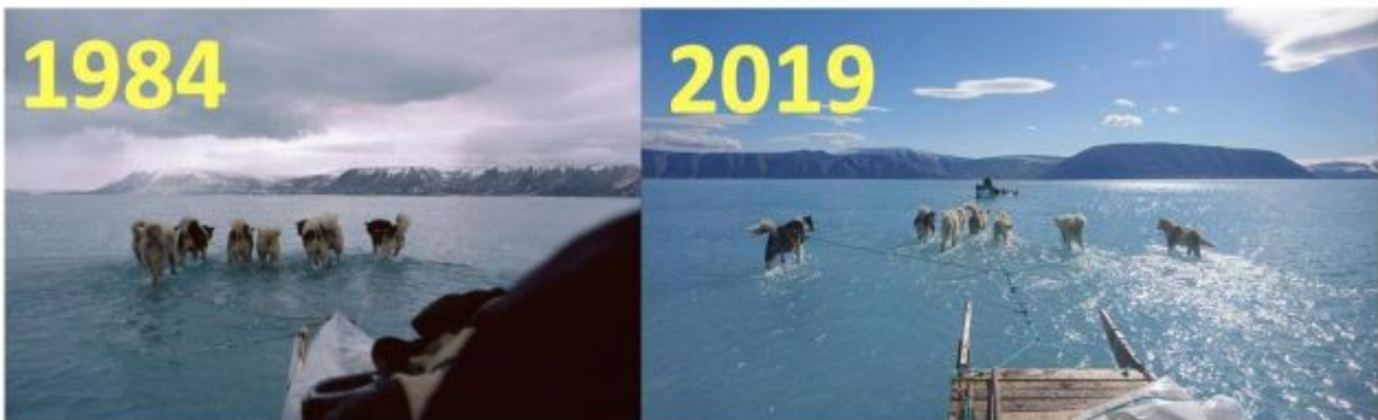
Spring in Greenland interpreted as climate change: «This is completely normal»: https://www.boringsale.dk/wordpress/spring-in-greenland-interpreted-as-climate-change-this-is-completely-normal/ , https://politiken.dk/klima/art7270247/ing-oplevelse-det-selv-i-1984 , https://edition.cnn.com/2019/06/17/health/greenland-ice-sheet-not-ank/index.html , twitter.com/bjornlomborg

But CNN said the picture was "evidence of our ongoing climate catastrophe." And Al Gore wants permission to use it in his slideshow.