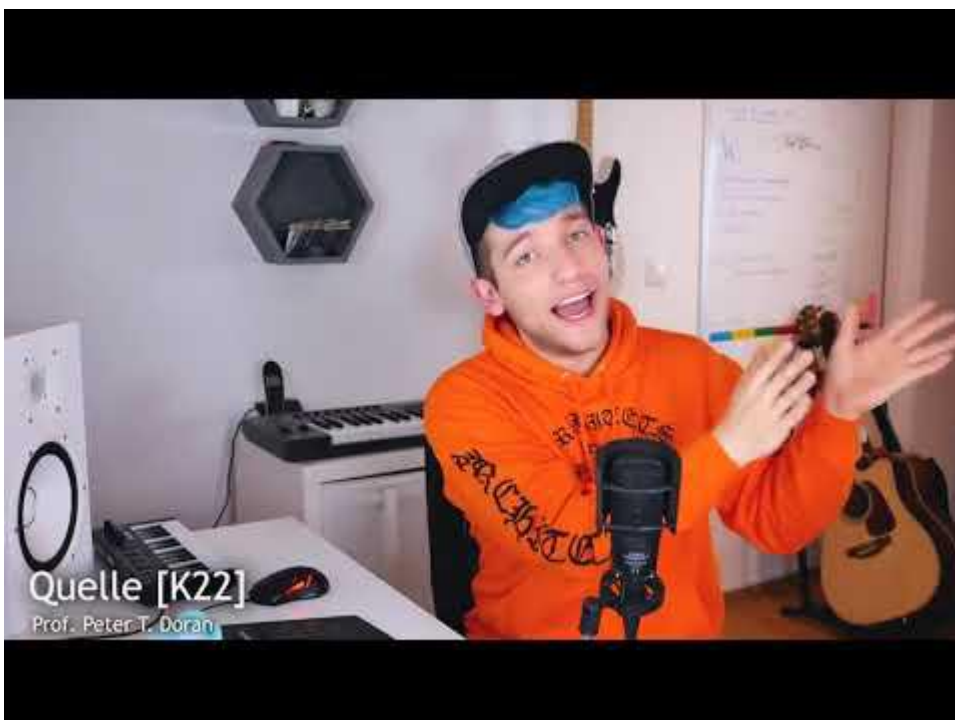
Bild 1 Eingebettetes Video von Rezo: „Die Zerstörung der CDU“. Vorsichtshalber der Link zu YouTube dazu:

Und genau so hat es der YouTuber „Rezo“ mit und in seinem Video gemacht: Rezo Video „Die Zerstörung der CDU“