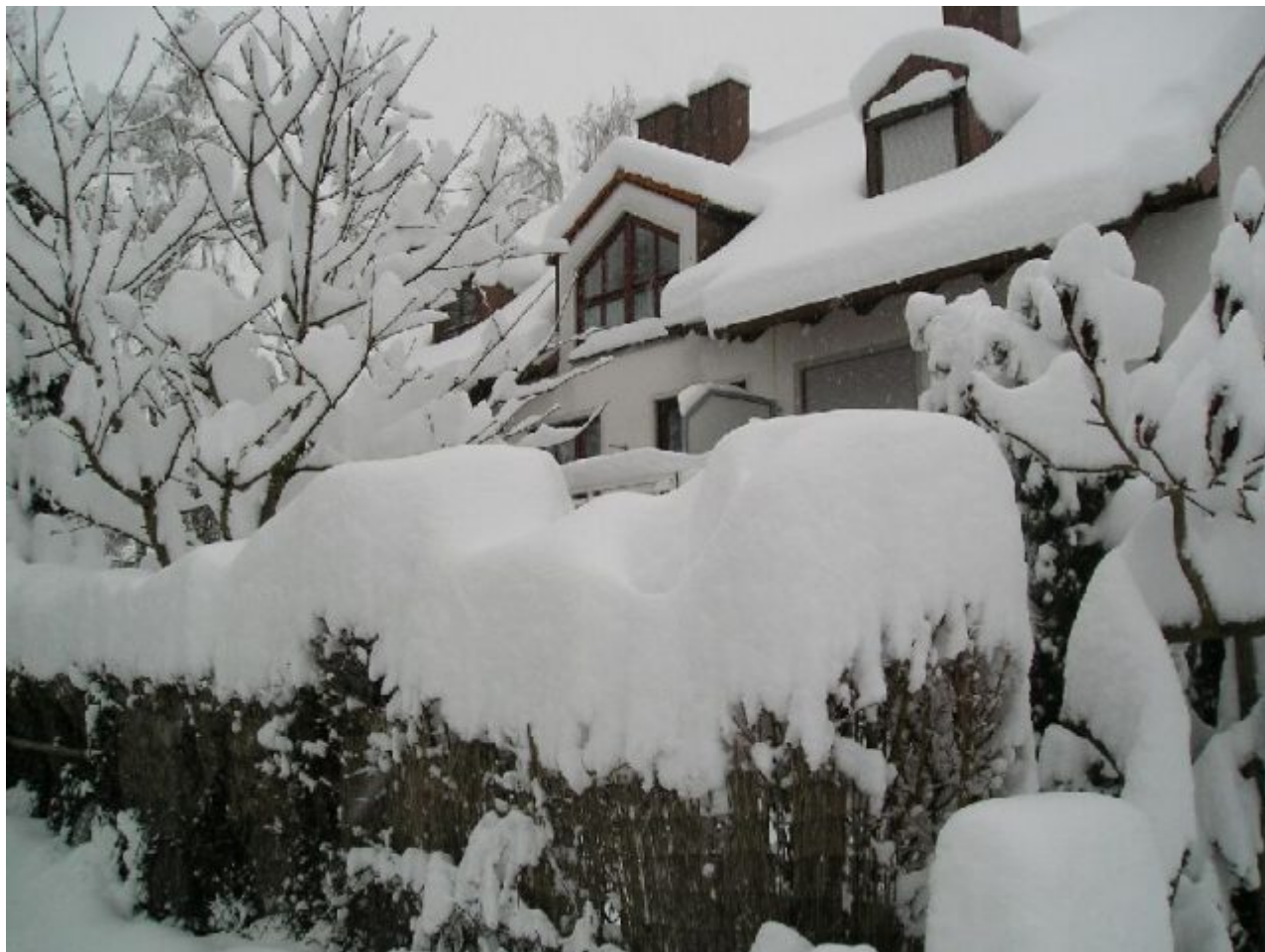
Immer mehr Schnee?