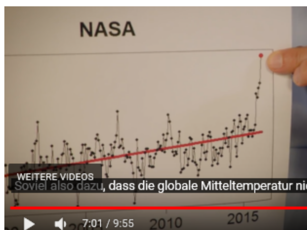
Bild 4 [7] Moderator zerpflückt AfD-Programm und bekommt Hassmails.

Man betrachte im Bild 4 den roten Punkt der globalen Maximaltemperatur. Süffisant und in seinem gewohnten, überheblichem Duktus, „beweist“ er damit die bereits erfolgte Überhitzung, welche wohl so weiter gehen soll.