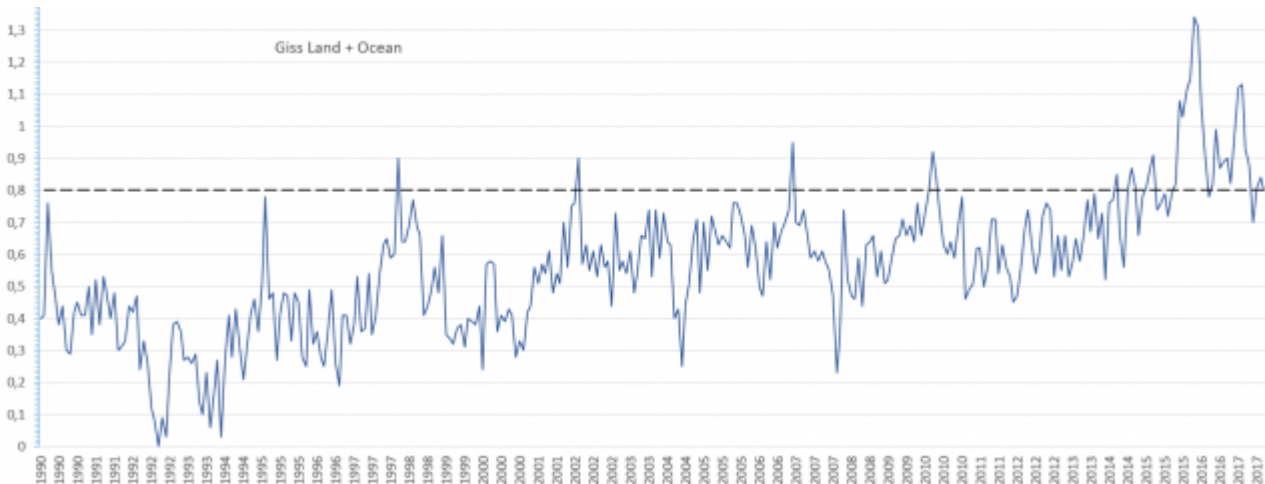
Bild 5 NASA GISS Daten von Bild 4 in Monatsauflösung, Stand 9.2017. Grafik vom Autor anhand des Datensatzes erstellt.

Nun sieht genau dieser Verlauf mit den bei Nasa Giss dazu ebenfalls hinterlegten Monatswerten gezeichnet, inzwischen wie in der folgenden Grafik (Bild 5) aus – ein eklatantes Beispiel, wie man kurzfristige Effekte – hier den des zyklischen, diesmal besonders großen El Nino-Ereignisses -, zum richtigen Zeitpunkt für Klimaalarm nutzen kann.