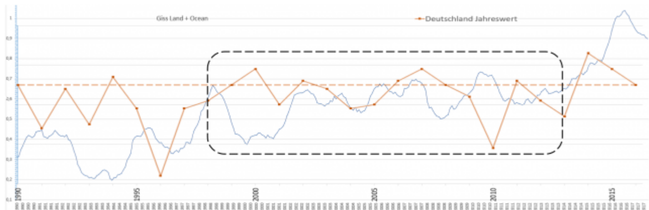
Bild 2 GISS Globaltemperatur 1990 – 2017 (gleitendes Jahresmittel, blau) und Deutschland DWD Jahreswerte (braun) übereinander gelegt (mit Anpassung an den Mittelteil des Zeitraums). Temperaturachse der Deutschlandwerte nicht mit den GISS-Werten übereinstimmend. Grafik vom Autor erstellt

Nimmt man die Werte seit dem Jahr 1990, zeigt es sich ebenfalls (Bild 2 und vor allem Bild 3). Auch die letzten Jahrzehnte „hinkt“ die Temperatur Deutschlands der Welt-Globaltemperatur deutlich hinterher. Da beide Temperaturverläufe in diesem Zeitraum schlecht korrelieren, kann man den Startwert unterschiedlich anlegen (Bereiche gestrichelt eingerahmt), am Ergebnis ändert es nichts.