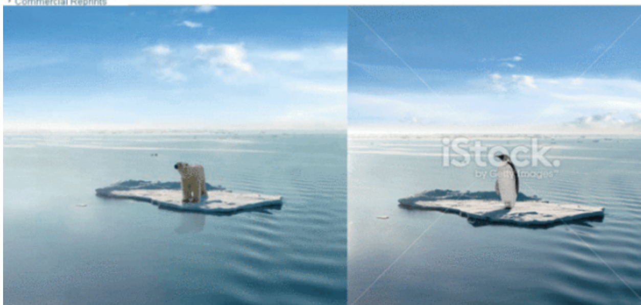
Abbildung 2: Das Fake-Bild (links) in Science, Mai 2010

Die Wirklichkeit: Die mittlere Eisausdehnung des Arktischen Meereises im September betrug während der Jahre 1996 bis 2005 6,46 Millionen km 2 . Im Zeitraum 2007 bis 2016 nahm die Fläche um 26% ab auf 4,77 Millionen km 2 ab. Trotz dieser Abnahme nahm die Eisbär-Population von einer im Jahre 2005 geschätzten Anzahl von 20.000 bis 25.000 Tieren auf 22.000 bis 31.000 Tiere geschätzt im Jahre 2015 zu. Siehe hier .