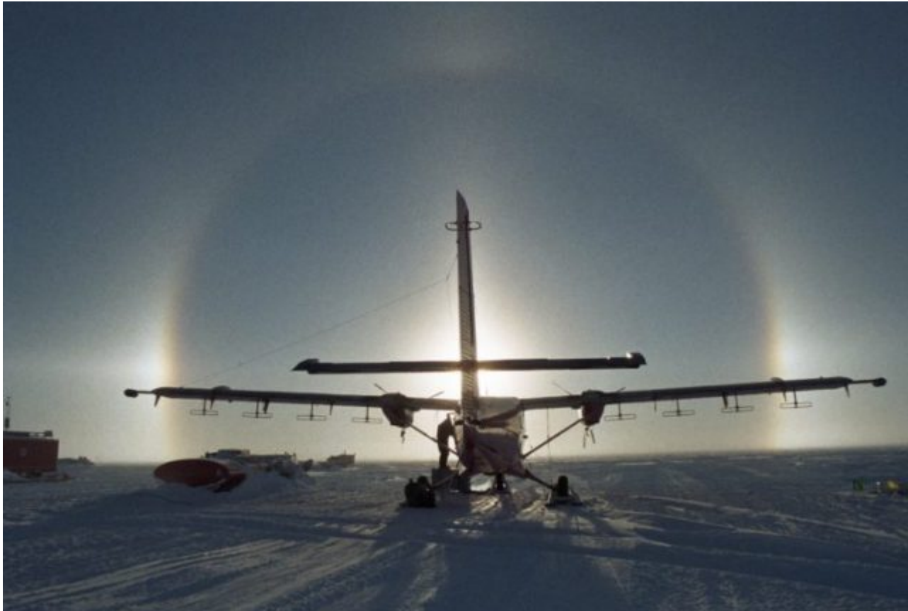
Abbildung 2: Das Flugzeug vom Typ Twin Otter des BAS enthält geophysikalische Messapparaturen, welche einige der magnetischen Beobachtungen in der Antarktis sammelten.

Der antarktische Eisschild enthält die größten Reserven von Süßwasser auf unserem Planeten – etwa 70% des Süßwassers der Erde – und er verliert gegenwärtig Eis, was zum steigenden Meeresspiegel beiträgt.