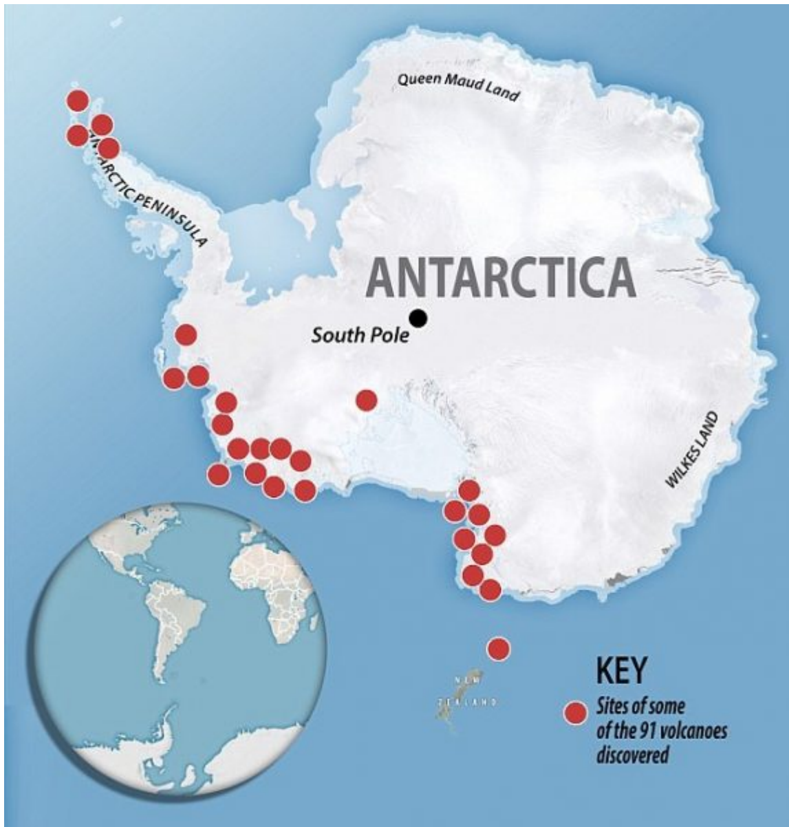
Abbildung 3: 91 Vulkane unter dem Eis – nach Bingham et al.

Auf Wikipedia findet man Folgendes über Nachfolgestudien von Steig et al. 2009: