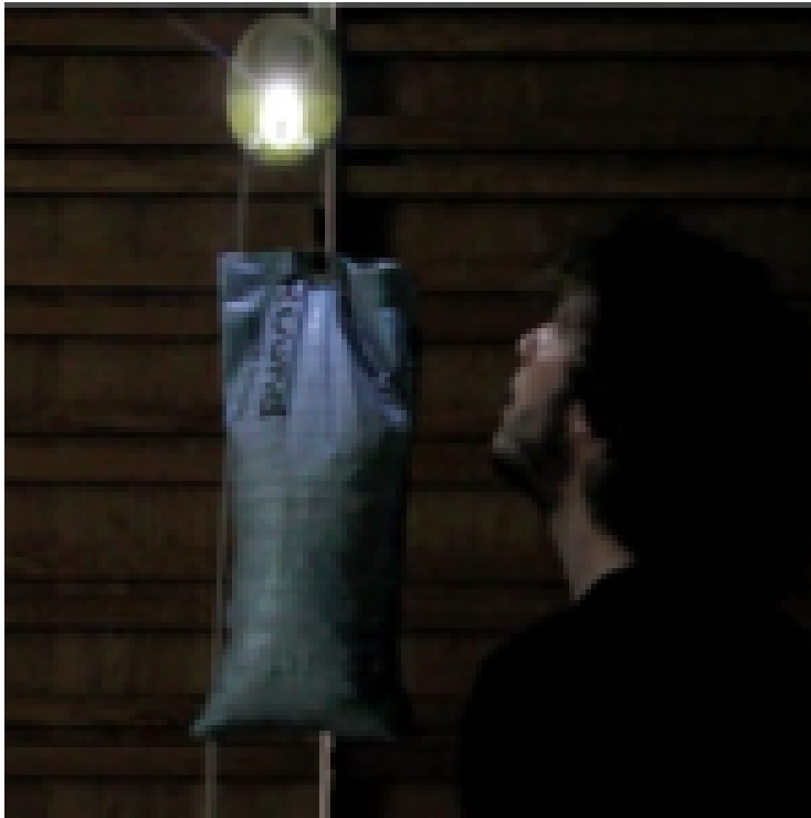
Bild 2 Screenshot mit Bild der Lampe im Betrieb. Der Sack mit dem Gewicht treibt den Generator an und muss dazu etwa alle 20 Minuten hochgezogen werden. Quelle: Werbevideo [3]