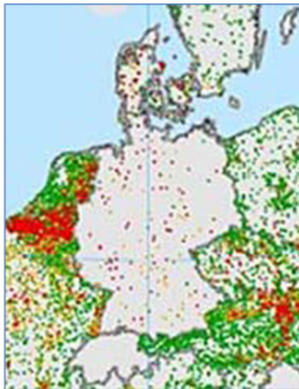
EU-Berichtszeitraum 2004-2007 2008-2011