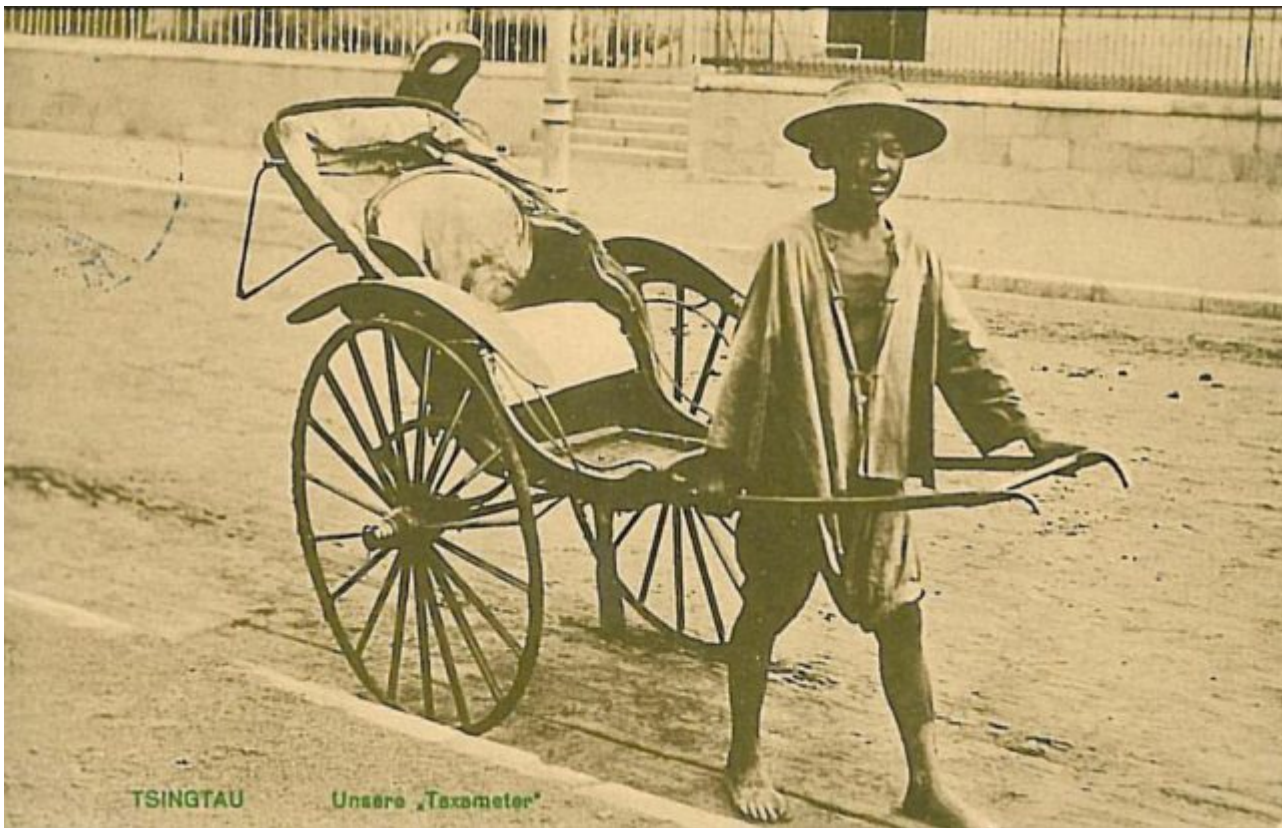
Bild 2. Unser Blick auf China ist auch heute noch von Vorurteilen aus der Kolonialzeit geprägt. Historische Aufnahme aus dem deutschen „Schutzgebiet“ Tsingtau (heute Kiautschou)

In einem weiteren Artikel der gleichen Online-Ausgabe finden sich interessante Zusatzinformationen, aus denen sich einiges über die Hintergründe und Stoßrichtung der neuen KKW-Strategie herauslesen lässt. Es wird darauf hingewiesen, dass China Solar- und Windenergie als zu unzuverlässig für eine stabile Energieversorgung des Landes einstuft. Andererseits scheint das Land aber auch nicht vollständig oder zumindest überwiegend auf Kernkraft setzen zu wollen. Für diese Änderung der früheren Zielsetzung eines massiven KKW-Zubaus werden drei wesentliche Gründe angeführt: Die Fukushima-Ereignisse, die zunehmende Feindseligkeit des Westens und die geringen Uranreserven des Landes. Darüber hinaus lassen sich nicht nur aus den vorhandenen, sondern auch aus manchen nicht vorhandenen Angaben zusätzliche interessante Schlussfolgerungen ziehen.