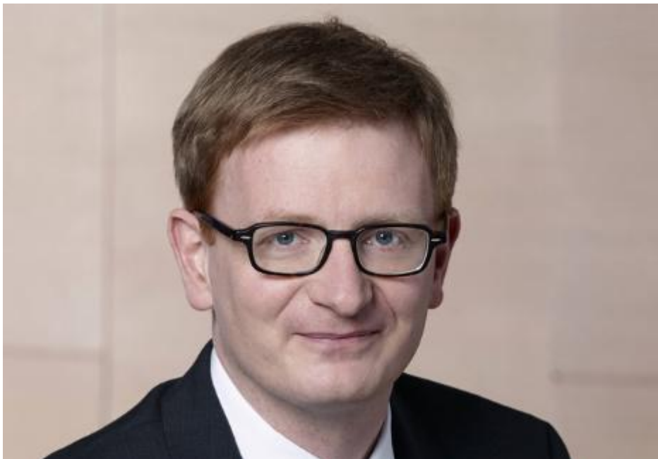
Bild [1] Will lieber die Chancen des Klimawandels in den Blick nehmen als die Gefahren: CDU-Bundestagsabgeordneter Philipp Lengsfeld vom Berliner Kreis.

klimaretter.info, 04. Juni 2017: Rechter Unions-Flügel folgt Trump