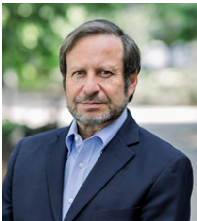
Der Buchautor Steven E. Koonin

Professor Koonin schickte mir im November einen fast endgültigen Entwurf zum Lesen und Kommentieren und ich habe sein Buch ein wenig überarbeitet, aber der Entwurf war schon damals in guter Form. Jetzt ist er noch besser. Ich habe vor ein paar Wochen ein signiertes Vorabexemplar erhalten, aber ich habe trotzdem eine Kindle-Version vorbestellt, um leichter darauf zugreifen zu können, und ich empfehle Ihnen, das auch zu tun. Dies ist ein wichtiges Buch, nicht nur weil Koonin ein brillanter und berühmter Physiker ist, sondern auch wegen des Inhalts. Es ist ein guter Überblick über die Wissenschaft, aber auch philosophisch wichtig.