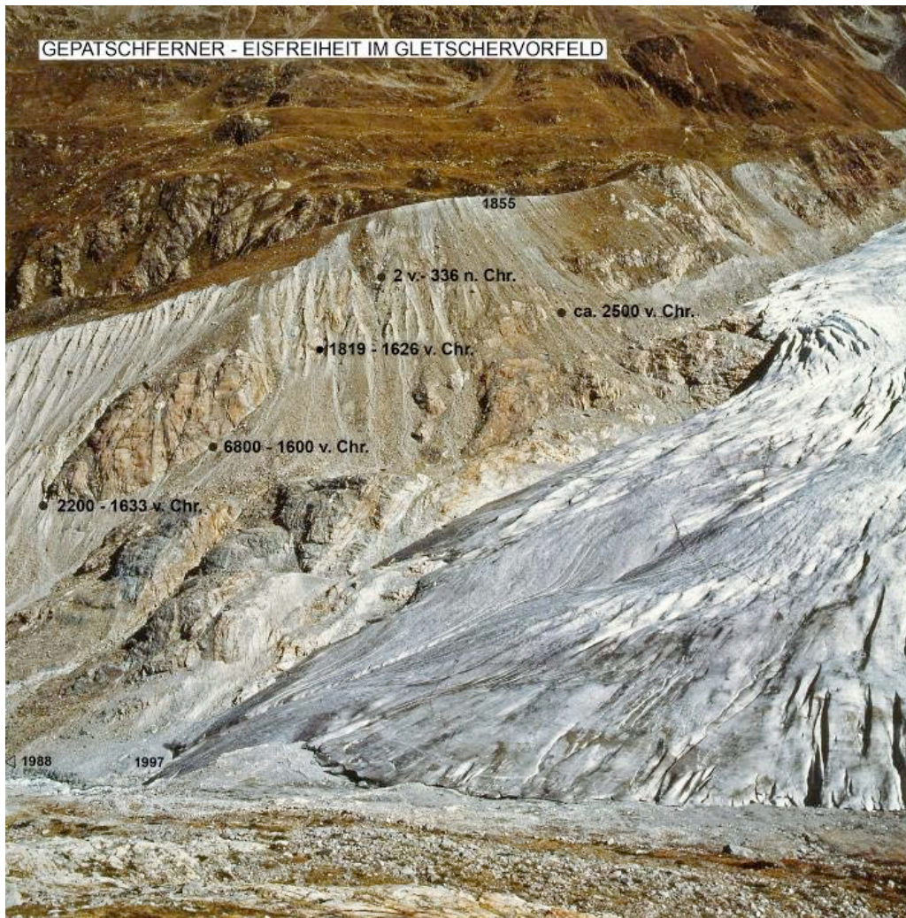
Abb. 2 Standort und Wachstumsperioden von Waldbäumen, die durch den gegenwärtigen Rückgang des Gepatschfeners – des zweitgrößten Gletschers der österreichischen Alpen – eisfrei geworden sind.

sowie zwischen 1965 und 1980 sind jeweils bis etwa 75 % der Gletscher angewachsen. Bemerkenswert ist die Vorstoßperiode der 1970er Jahre als Folge einer Abnahme der Sommertemperatur um etwa 1° C zwischen 1950 und 1980. In dieser Zeit ist der CO 2 -Gehalt der Luft unbeeindruckt fortgesetzt stark angestiegen.