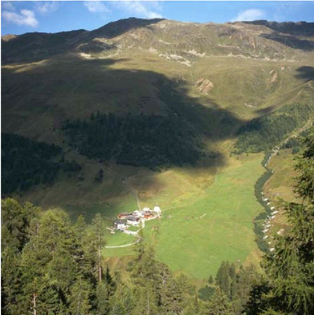
Abb. 5 Die nacheiszeitliche Wald- und Baumgrenze lag etwa 100 bis 150 m höher als heute.

Gernot Patzelt: Nach meinem Informationsstand nehmen derzeit die Eismassen und damit die eisbedeckte Fläche weltweit bei einem Großteil der Gebirgsgletscher ab. Das ist hauptsächlich auf die höheren Temperaturen der Abschmelzzeit und auf die dadurch verlängerte Schmelzperiode im Sommerhalbjahr zurückzuführen. Daneben gibt es aber bemerkenswerte