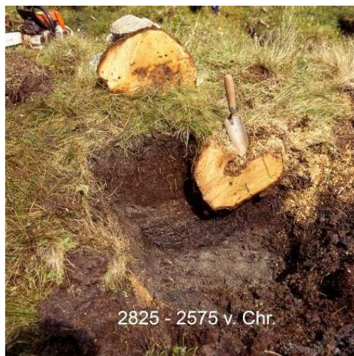
2825 - 2575 v. Chr.