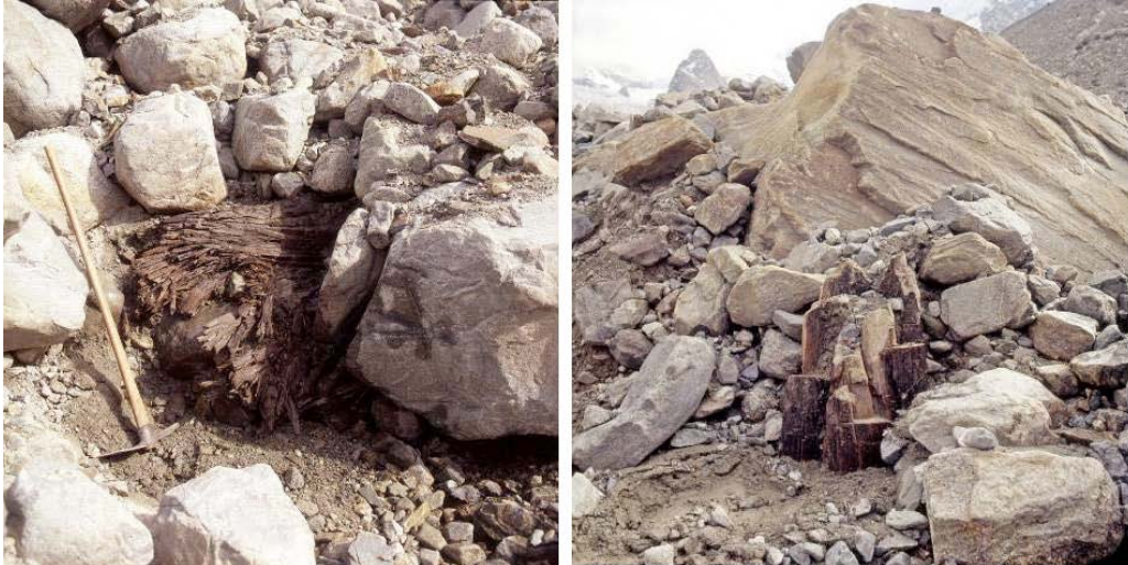
Abb 3. Die schmelzenden Gletscher geben Reste von Bäumen frei, die früher in Höhenlagen deutlich oberhalb der heutigen Grenze für das Baumwachstum gewachsen sind. Sollten heute auf Höhe der nacheiszeitlichen Wald- und Baumgrenze wieder Bäume wachsen können, müsste die Temperatur in der Vegetationsperiode längerfristig um geschätzte 0,7 bis 1° C ansteigen.

Gernot Patzelt: Durch den Gletscherrückgang werden jetzt Areale eisfrei, die ursprünglich von Wald bewachsen waren. Davon sind in Moränenmaterial eingebettete Bäume manchmal in erstaunlich gutem Zustand erhalten, so dass sich an den Jahresringen Lebenszeit und Überfahrungszeitpunkt durch die Gletscher oft mit Jahresschärfe feststellen lassen. Manche Bäume sind so gut erhalten, dass sie noch den typischen Harzgeruch beispielsweise der Zirbe haben.