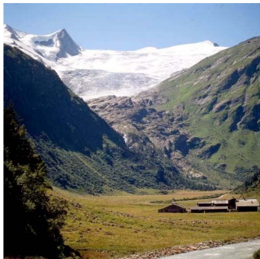
Abb 1: Gletscher auf dem Rückzug: Das Schlatenkees am Venediger 1852 (links) und 1995 (rechts). Als Beweis für einen menschengemachten Klimawandel denkbar ungeeignet.