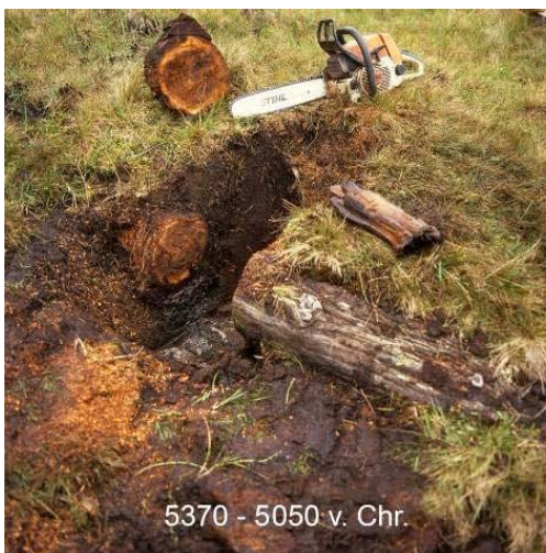
5370 - 5050 v. Chr.