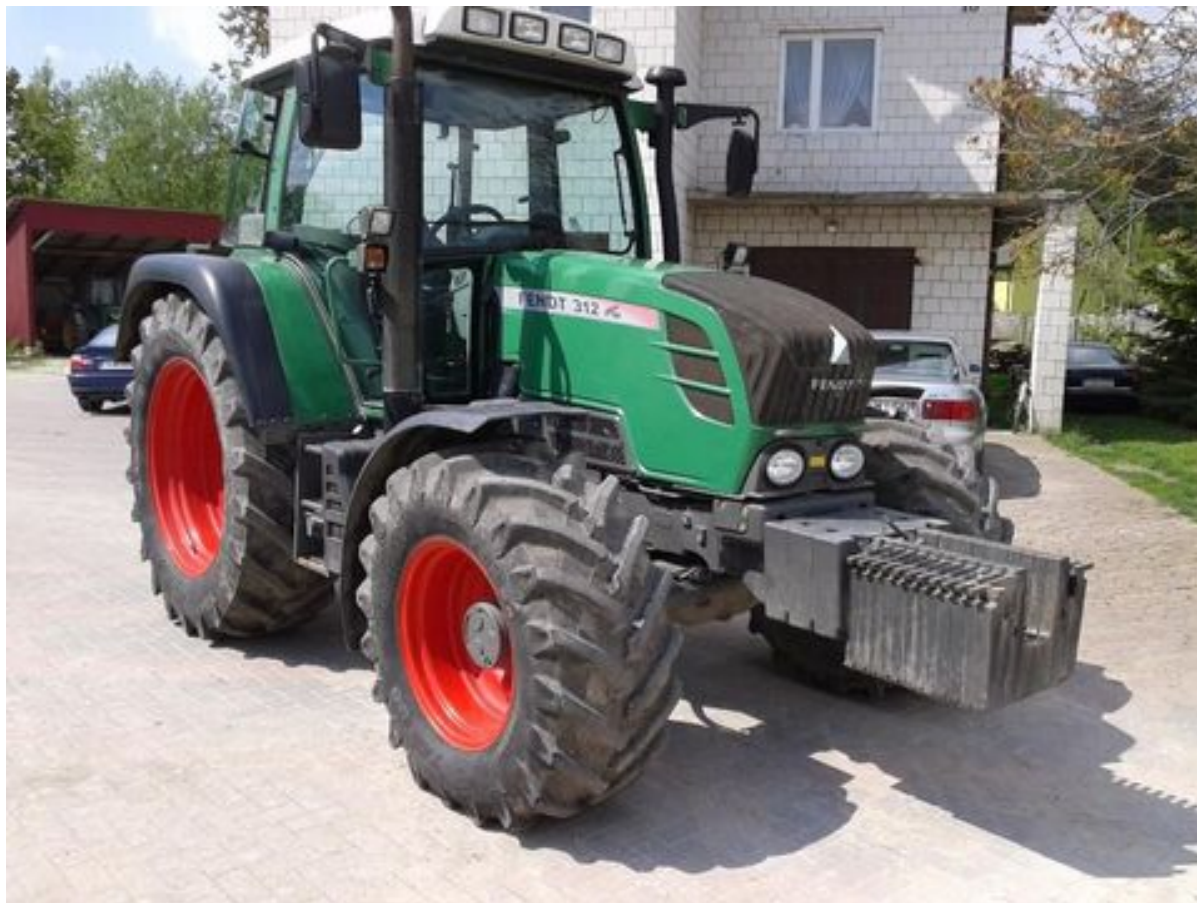
Abb.1 Fendt 312 Vario (Ádám Bánki TRakodó Import gépek 2017)

Als WKA nehmen wir die Vestas 126 (mit Getriebe, sorry, liebe Fa. Enercon)