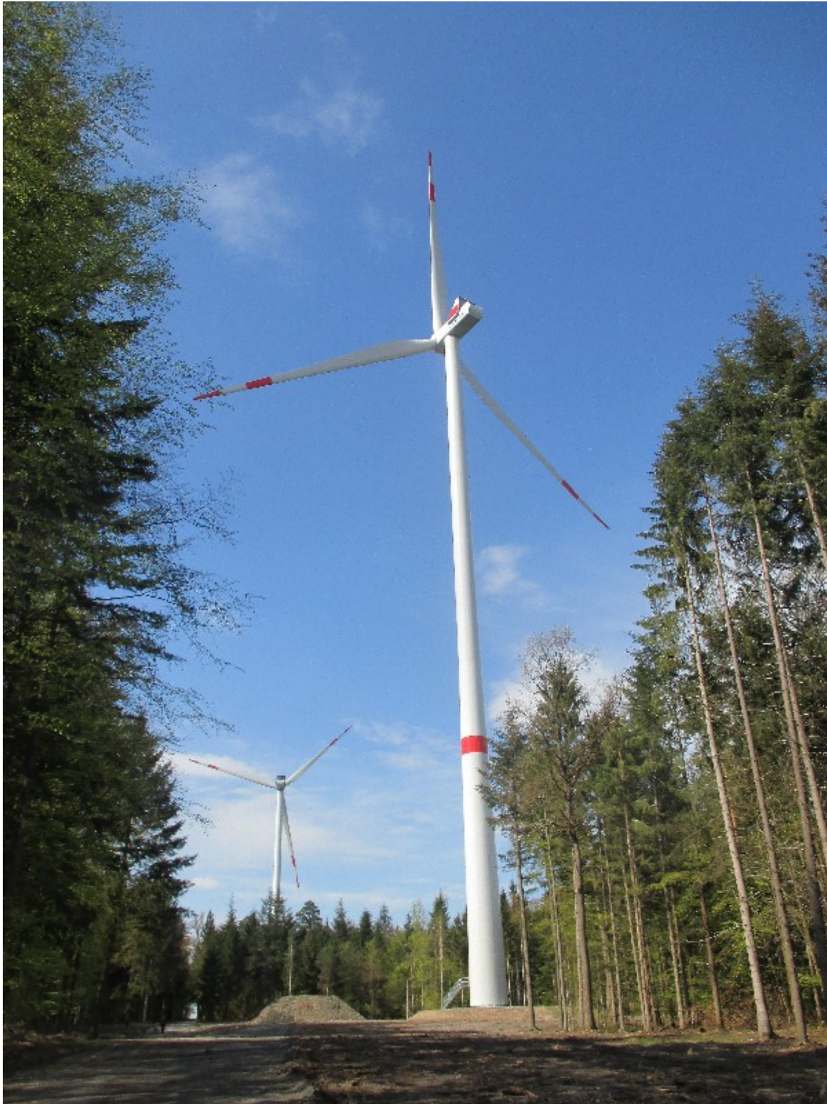
Abb.2 V-126 Hainhaus (Tilman Kluge 2016)

Wichtig ist, daß der Vergleich auf einer gemeinsamen Grundlage, hier sinnvollerweise und realistisch auf der Fläche eines Windparks, erfolgt.