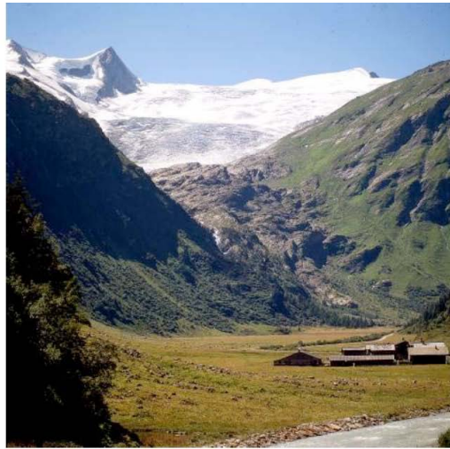
Abb 1: Gletscher auf dem Rückzug: Das Schlatenkees am Venediger 1852 (links) und 1995 (rechts). Als Beweis für einen menschengemachten Klimawandel denkbar ungeeignet.