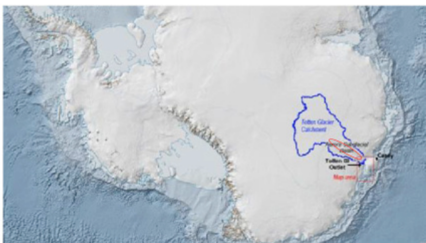
1100km long, averaging over 500km wide Oval represents approximate Sabrina and Aurora subglacial basins

et al haben auch Eis durchdringendes Radar eingesetzt zur Untersuchung des Meeresgrundes sowohl im Sabrina- als auch im Aurora-Becken, um zu bestätigen, dass der Totten-Gletscher tatsächlich durch beide Becken hindurch schon vor 3 Millionen Jahren im Pliozän (vor dem Einsetzen der gegenwärtigen Eiszeiten) geschmolzen war, wobei der CO 2 -Gehalt etwa 400 ppm betragen hatte. Dies wurde in den PR-Alarm hinein geworfen – es geschah zuvor bei 400 ppm!!! Mit den gegenwärtigen Schmelzraten würde dies etwa 3 Jahrtausende in Anspruch nehmen, was den Meeresspiegel um 2,9 Meter steigen lassen könnte – eine keineswegs alarmierende Rate von 10 cm pro Jahrhundert. Auch das ist möglicherweise noch viel zu hoch gegriffen, müsste doch das gesamte wärmere Wasser aus dem Aurora-Becken ungestört durch den gerade entdeckten Einschnitt im Rücken strömen.