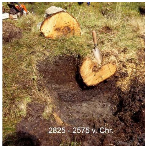
Abb. 6 Baumreste in hochgelegenen Mooren der Ostalpen.

Ausnahmen: Auf den sehr niederschlagsreichen, westorientierten Gebirgsseiten