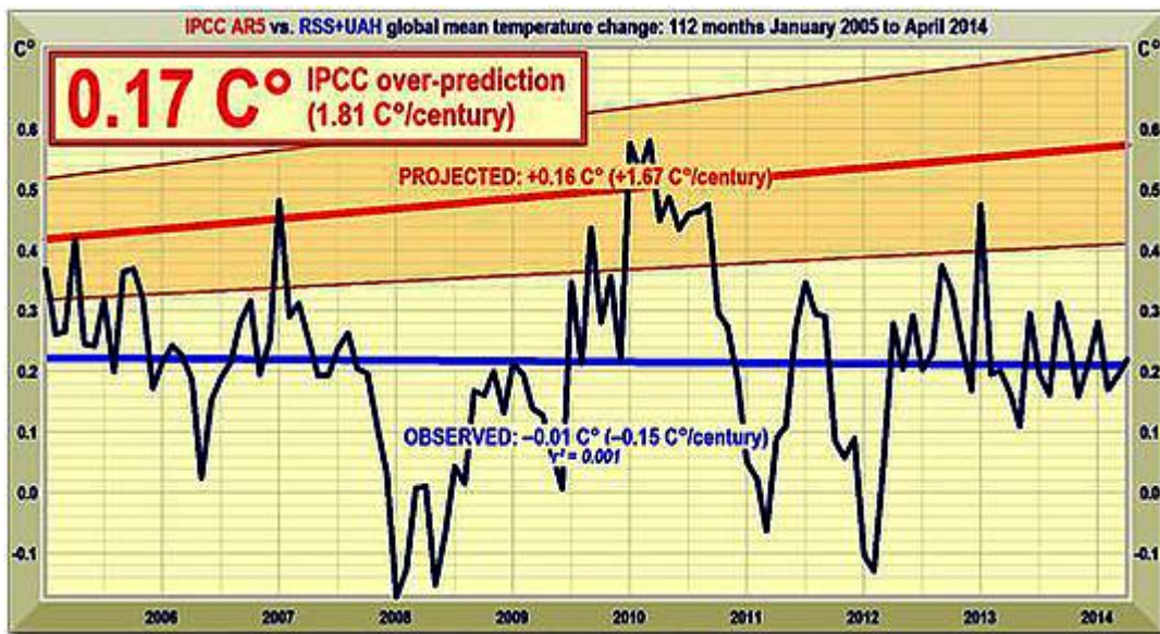
Abbildung 3: Vorhergesagte Temperaturänderung seit 2005 mit einer Rate äquivalent zu 1,7 (1,0; 2,3)°C pro Jahrhundert (orangene Fläche mit dicker roter Trendlinie des Best Estimate), verglichen mit den beobachteten Anomalien (dunkelblau) und Trend (hellblau).

Bemerkenswerterweise liegen auch die jüngsten und erheblich reduzierten kurzfristigen Projektionen der globalen Erwärmung immer noch exzessiv zu hoch (Abbildung 3).