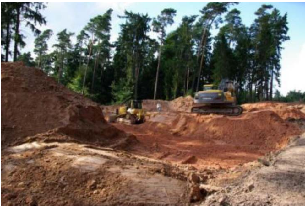
Bild 12: Für jedes Windrad werden 10.000 m 2 Wald zerstört und das Umfeld dauerhaft biologisch entwertet

Auch der Schutz unserer Kulturlandschaft gehört zum Markenkern des Naturschutzes und steht in den Satzungen ihrer Verbände. Windräder und neue Stromtrassen verkehren auch dieses Ziel in sein Gegenteil. Der Kölner Dom ist einzigartig und 157 m hoch. Windräder sind 200 m hoch und höher. 22.600 dieser Industriegiganten stehen bereits und es werden immer mehr. Sie degradieren unsere Kulturlandschaft zum Industriegebiet. Trotzdem fordern Spitzenfunktionäre der Umweltschutzverbände den weiteren Ausbau. Jetzt geben sie auch noch die Wälder für Windräder frei, sogar in Landschaftsschutzgebieten, in Naturparks und nahe an Naturschutzgebieten sollen Windräder hin. Gegen Geld verzichten sie auf ihr