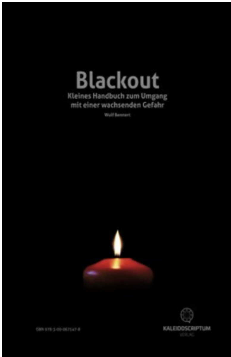
Broschüre „Blackout“ von Wulf Bennert

Wichtigstes Anliegen des „Kleinen Handbuchs“ von Wulf Bennert ist es, die Leserschaft auf aktuellem Stand über Möglichkeiten und Grenzen rechtzeitiger Vorsorge gegen einen Blackout zu informieren sowie über hilfreiche Verhaltensstrategien während seiner Dauer. Diese können je nach Wohn- und Lebenssituation recht unterschiedlich sein. Die Broschüre bietet eine breite Palette verschiedener Empfehlungen, die vom Erkennen des Blackout über den richtigen Umgang mit dem Trinkwasser- und Toilettenproblem, über Licht im Dunkeln, Zubereitung von Lebensmitteln, den Weiterbetrieb der Heizung bis zur Auswahl des geeigneten Notstromaggregats und der möglichen Nutzung einer Solaranlage bei Stromausfall reichen. Es sind Ratschläge, die im Ernstfall das Überleben sichern können. Deshalb sollte die Broschüre in jedem Haushalt verfügbar sein.