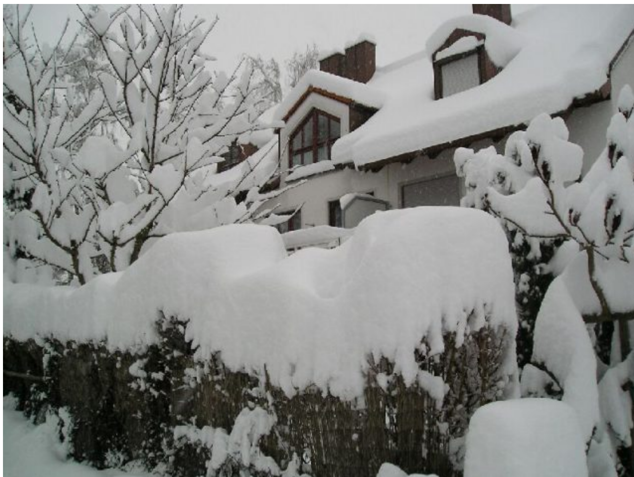
Immer mehr Schnee?