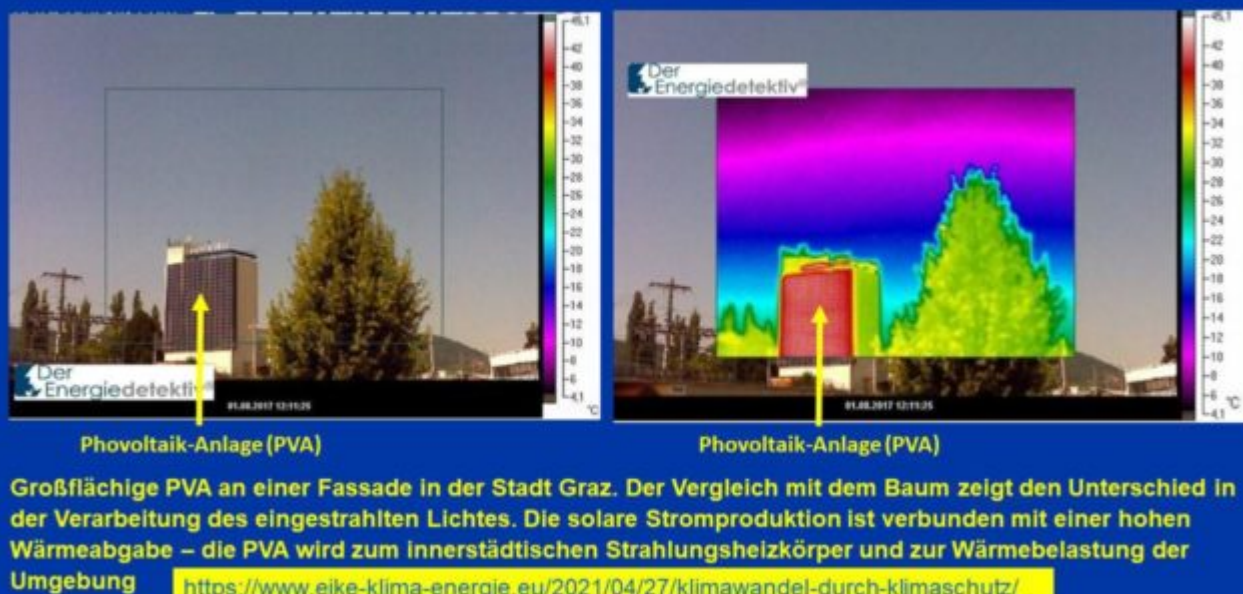
Abbildung 3: Photovoltaik-Anlagen werden zu innerstädtischen Strahlungsheizkörpern

Erderwärmend wirkt auch ein weiterer Effekt: Solaranlagen weisen gegenüber der unbelasteten Naturlandschaft eine deutlich höhere Absorptionsrate auf. Das bedeutet, dass insgesamt auch ein höherer Anteil des Sonnenlichts im bodennahen Bereich absorbiert und ein geringerer Anteil reflektiert wird. Das spielt insbesondere im Winter im Vergleich zu einer Schneedecke eine große Rolle. Es ergibt sich eine störende Rückwirkung auf den natürlichen Ablauf der Jahreszeiten. Das dürfte die Stressbelastung des im Boden überwinterten Lebens