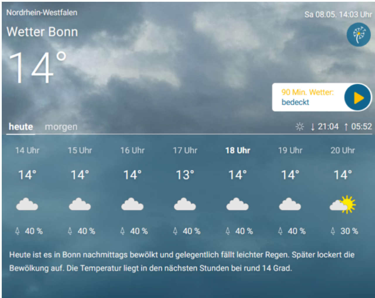
Abb.16, Tatsächliches Wettergeschehen in Bonn. Quelle wie Abb.15

Und auch der Süden meldete nicht die magischen 22°. Der Autor hat exemplarisch die Abb. gewählt, die am 08.05.2021 im Süden Deutschlands die höchsten Temperaturen ausweist.