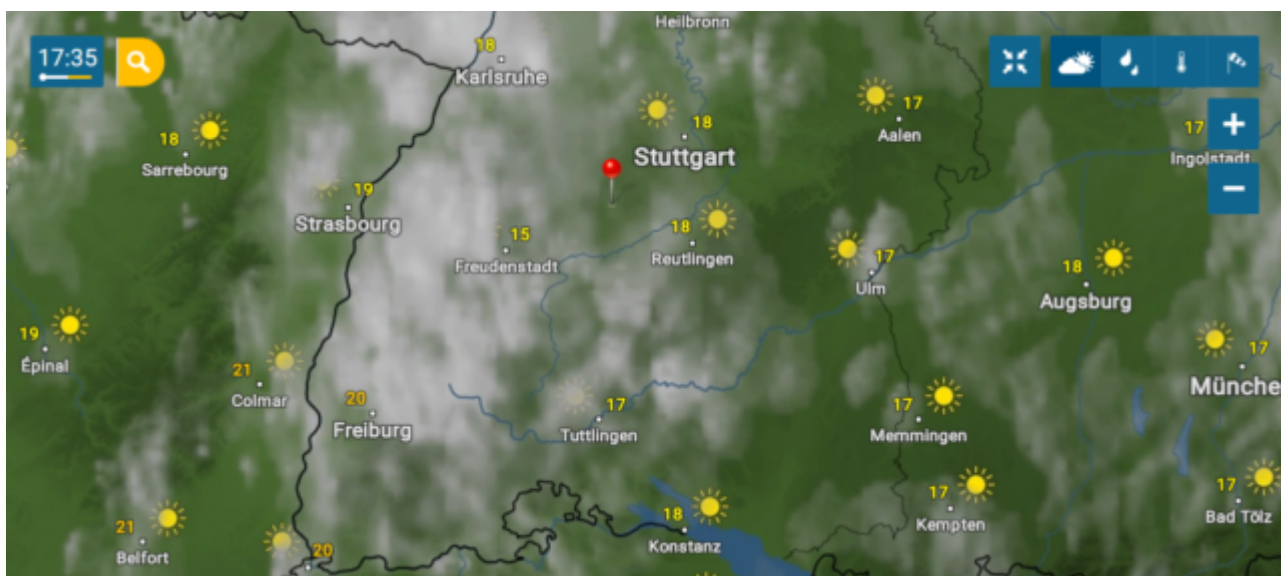
Abb.17 zeigt für den Süden Deutschlands ein Temperaturniveau nicht von „anheimelnden“ 22°C, sondern von „bescheidenen“ 17/18°C. Quelle, wie Abb.15. Nur Freiburg gab 20°C an. Der Autor möchte Ihnen dazu eine Graphik von Herrn Josef Kowatsch zeigen.

Und auch der Süden meldete nicht die magischen 22°. Der Autor hat exemplarisch die Abb. gewählt, die am 08.05.2021 im Süden Deutschlands die höchsten Temperaturen ausweist.