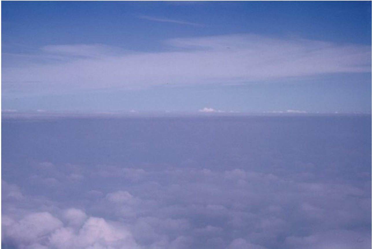
Oberhalb der Inversionsschicht.

In den 1990er Jahren stellten Klimawissenschaftler fest, dass urbane Wärmeeffekte die Minimaltemperaturen um einige Grad anheben, nicht aber die Maximaltemperaturen. Solche Gebiete erwärmen sich nicht, sondern wurden weniger kalt. Das deutet darauf hin, dass die Verstädterung die lokalen Inversionsschichten unterbrochen hat. Die zunehmende Bedeckung des Landes mit wärmespeicherndem Asphalt und Beton verringert die Oberflächenkühlung. Die Beseitigung von Vegetation oder Nässe führt zu heißeren Oberflächen, die mehr Wärme speichern. Verkehr, hohe Gebäude oder Frostfächer stören die Oberflächenwinde, die wärmere Luft an die Oberfläche bringen. All diese Dynamiken erhöhen die Mindesttemperaturen und damit die Durchschnittstemperatur. Verschiedene lokale Störungen der Inversionsschichten können besser erklären, warum einige US-Wetterstationen Erwärmungstrends zeigen, während 36 % eine langfristige Abkühlung aufweisen.