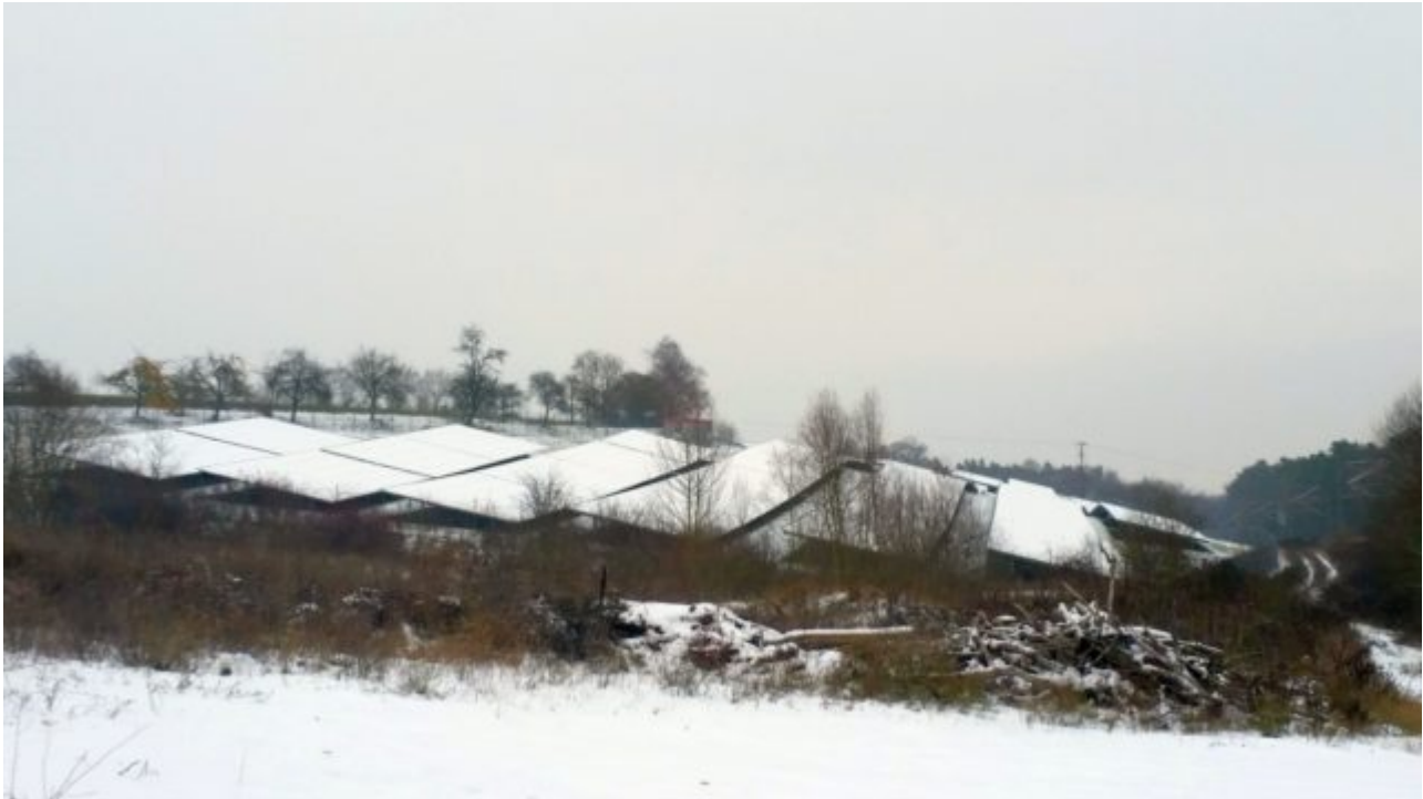
Demmig: Photovoltaik Fläche im Schnee

Daher zu Hause Strom aufladen, und in der Garage vorwärmen.