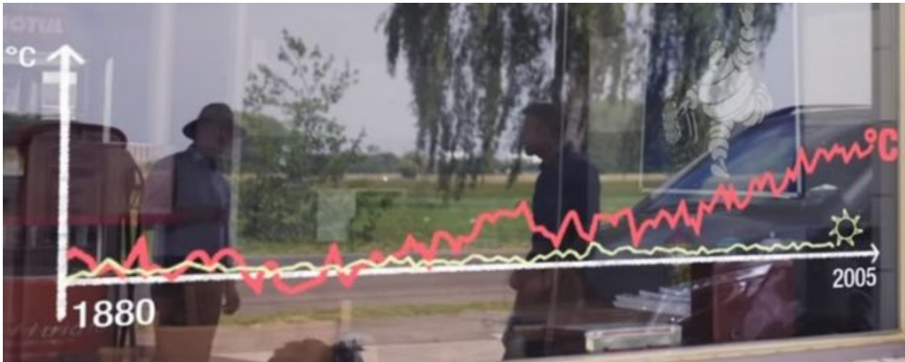
Abb. 1: Der Screenshot aus der Terra-X Sendung vom 18.10.2020 im ZDF zeigt die Sonnenaktivität in einer ungeeigneten gestauchten Skala

Deshalb sieht es so aus als ob die Sonnenaktivität seit 1880 unverändert ist, die Temperatur jedoch ansteigt.