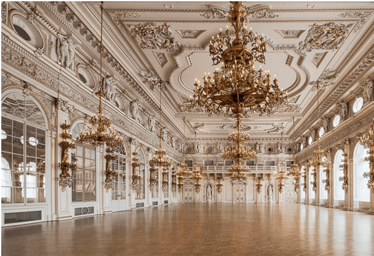
Geoethik mit Stil: Der Spanische Saal im Hradschin in Prag

Er richtete auch das einflussreiche Internationale Komitee für Geoethik ein, mit dem Ziel, parteiische Politik abzuschaffen und die offene Debatte über wissenschaftliche Fragen an den Universitäten wieder einzuführen. Der Ausschuss hielt seine Eröffnungskonferenz in Prag ab, wo die Vorträge im Spanischen Saal des Hradschin-Palastes auf Einladung des damaligen Präsidenten Vaclav Klaus gehalten wurden, der ebenfalls sprach.