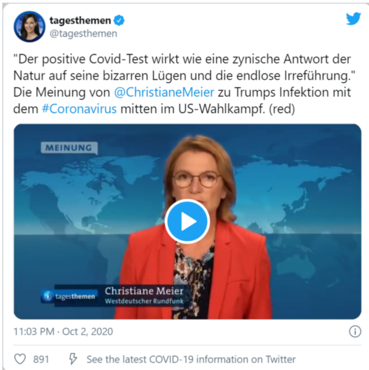
Bild 4 Tweet

Dazu das aktuelle „Wissensniveau“ in unseren Fernsehanstalten: