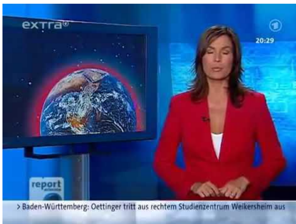
Bild 1 [1] Eingebettetes Video. ARD Reportage über den Klimaschwindel des IPCC. Vorsichtshalber der YouTube-Link

... beginnt die Reportage. Gesendet wurde sie am 22. Mai 2007 von der ARD. Man glaubt es kaum, damals war kritische Information über den IPCC und zum Dogma des „menschengemachten“ Klimawandels noch möglich.