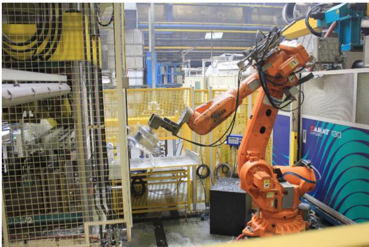
Bild 2. Viel Maschine, wenig Mensch: In modernen Industriebetrieben wurden schwere und gefährliche Arbeiten längst von Robotern übernommen

Die modernen Wissenschaften in Bereichen wie Ingenieurwesen, Physik, Medizin, Biologie, Chemie und Pharmakologie ermöglichen heute eine zuverlässige, gesunde, reichhaltige und auch wohlschmeckende Vollversorgung der gesamten Bevölkerung mit Nahrung und medizinischer Versorgung. Dieser hohe Lebensstandard ermöglicht es uns, überall auf der Welt die jeweils dort erzeugten Nahrungs- und Genussmittel von Getreide und Feldfrüchten über Fleisch, Obst und Gemüse einzukaufen. Wer es sich leisten kann, kann selbst exotischste Produkte schnell und frisch aus aller Herren Länder beziehen. Und wer meint, es „gesünder“ haben zu müssen, kann auf sogenannte Bioprodukte, Veganismus oder – im Gesundheitsbereich – auf alternative Ansätze wie Homöopathie oder Akupunktur zurückgreifen.