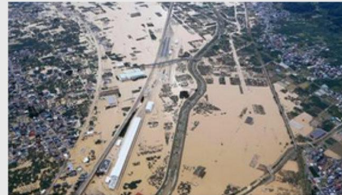
Taifun "Hagibis" hat in Japan mehr als 90 Todesopfer gefordert.

Der Taifun Hagibis, der im letzten Oktober über Japan hinweggezogen ist, wird im Bericht als Naturkatastrophe mit den größten Schäden im Jahr 2019 gelistet: 17 Milliarden US Dollar. Der Sturm löste in den Präfekturen Miyagi und Fukushima Erdbeben und Überschwemmungen aus. Mehr als 90 Menschen kamen ums Leben. Aber auch in Europa gab es vor allem durch Gewitterstürme große Schäden - wenn diese auch bei Weitem nicht so katastrophal ausfielen wie in Afrika oder Asien.