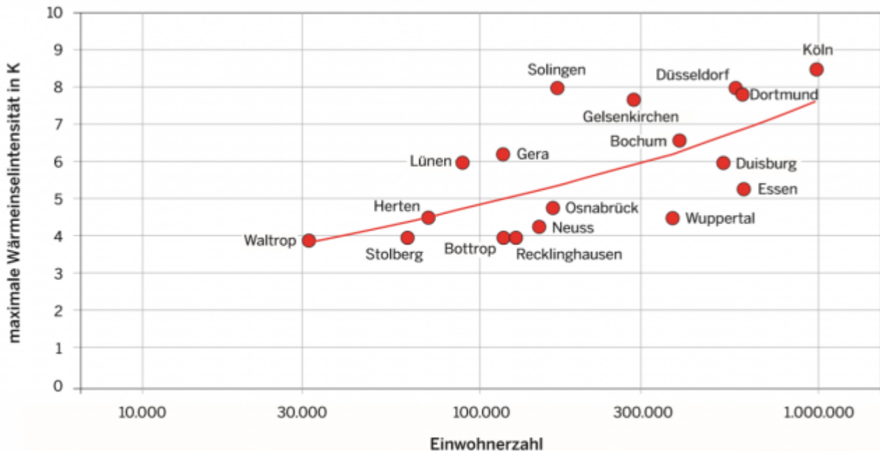
Abbildung 32: Maximale Wärmeinselintensitäten in Abhängigkeit von der Einwohnerzahl für ausgewählte Städte überwiegend aus NRW (KUTTLER 2011)

die Städte und selbst Randgebiete bekommen durch die Urbanisierung wesentlich höhere Inseltemperaturen [7]. Die dort (auch privat) gepflanzten Obstbäume sind damit ein ideales Brut- und Ausbreitungsgebiet solcher mehr Wärme liebender, teils eingeschleppter Arten.