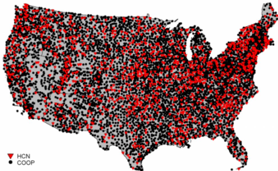
Abbildung: Verteilung der Stationen im U.S. Cooperative Observer Network im CONUS. Stationen vom USHCN, Version 2, sind als rote Dreiecke gekennzeichnet. Quelle

Alles, was die NOAA gemacht hat war, die von uns benannten sichtbaren Symptome zu behandeln (indem man sie einfach entfernte). Die Wurzel des Übels packte man jedoch nicht an und verwendete weiterhin die Mehrzahl der Daten darin – Daten mit der gleichen Art von Problemen und Inhomogenitäten, die schon im USHCN-Unterdatensatz erkannt worden waren. Das USHCN bestand aus 1218 Stationen aus über 8700 COOP-Stationen , und jene verbleibenden Daten werden herangezogen, um den U.S. Climate Divisional Dataset zu berechnen, welcher dann wiederum als heutige „offizielle“ Temperatur-Mittelwerte verkauft wird. Im Grunde war alles, was sie taten, das Problem unter den Teppich zu kehren und dann zu tönen, dass man über Algorithmen verfüge, um schlechte Daten zu „fixieren“.