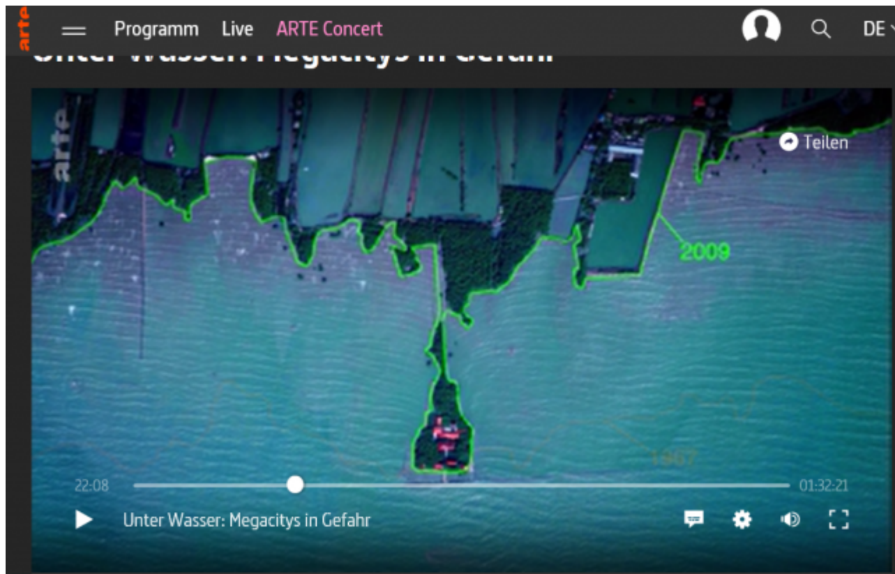
Bild 3 ARTE-Video: Diese Landzunge vor Bangkok war ursprünglich hinter der Küstenlinie. Auf der Landzunge ein Tempel, der im damaligen Dorf stand.

Küsten des Golfs von Thailand erodieren. Die schützenden Mangrovenwälder werden von Menschenhand beseitigt oder durch Erosion zerstört. In den letzten 40 Jahren konnte das Meer so 5 km weit ins Landesinnere vordringen .... Zum Schluss (des Reportageterteils Bangkok) folgt noch: Ein Experte erklärt, dass es ein Menetekel sei und dass das Meer bis Bangkok City vordringen wird „... und es wäre nun Zeit, über Schutzmaßnahmen nachzudenken ...“