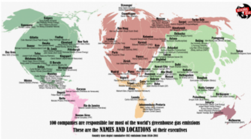
Names and Location of the Top 100 People Killing the Planet, 2019 - by Jordan Engel

"The earth is not dying, it is being killed, and those who are killing it have names and addresses." - Utah Phillips