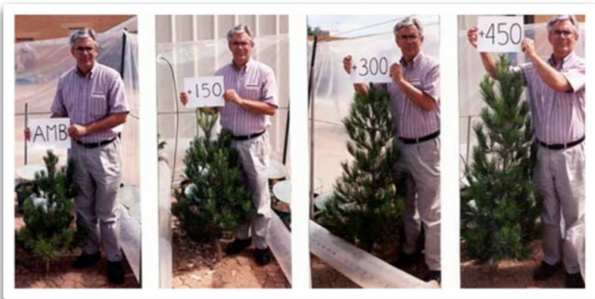
Abbildung 7: Pflanzenwachstum bei verschiedenen CO 2 -Niveaus.

Anmerkung: Ich möchte einen weiteren, kleineren Aspekt der Frage nach dem sozialen Nutzen von Kohlenstoff hinzufügen, und zwar die „Ergrünung“ des Planeten infolge eines gesteigerten atmosphärischen CO 2 -Gehaltes. Treibhausgas-Besitzer reichern die Luft in ihren Treibhäusern routinemäßig mit CO 2 an, um das Pflanzenwachstum zu verbessern. Abbildung 7 zeigt das Pflanzenwachstum bei umgebenden CO 2 -Niveaus ebenso wie das gegenwärtige Niveau sowie ein um 150, 300 und 450 ppmv höheres Niveau.