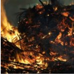
US Forest Area Burned 1926-2017