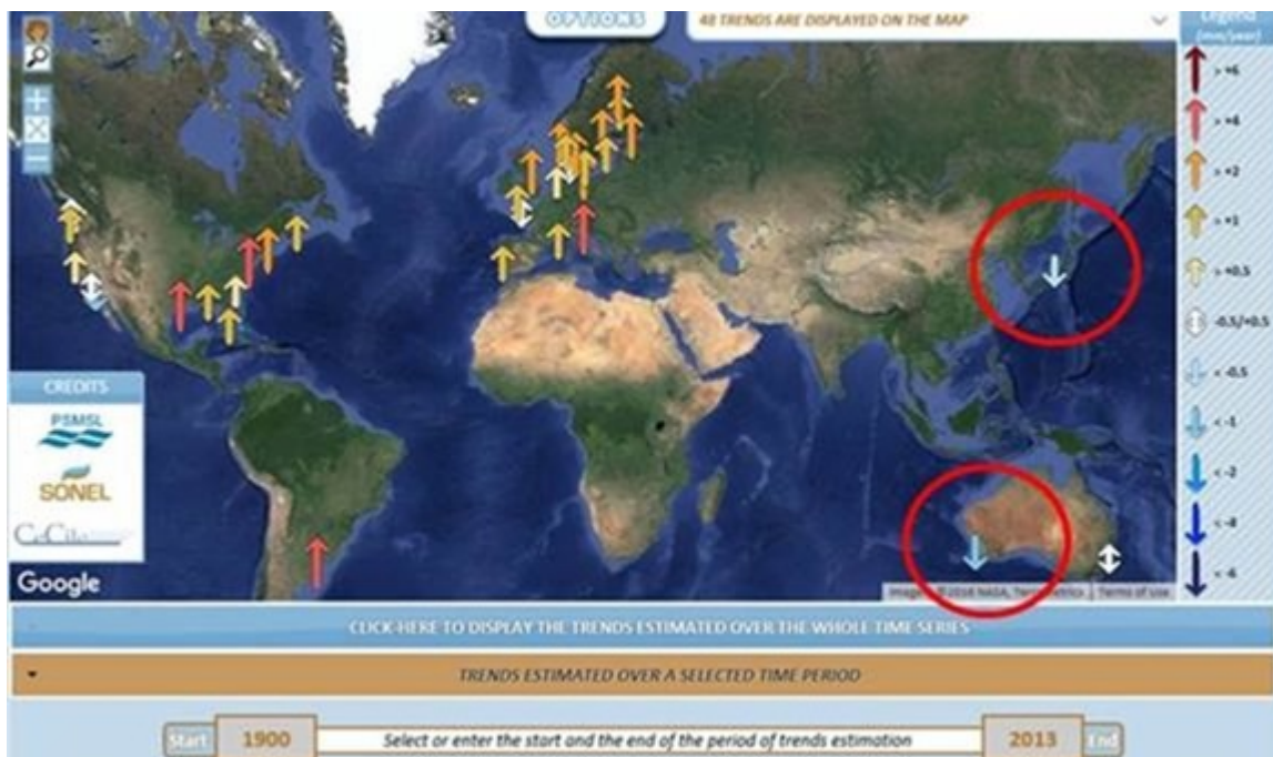
Abbildung 2 – Absolute Meeresspiegelanstiegsraten (relative Meeresspiegelanstiegsrate von der Pegelmessung, absolute vertikale Landbewegung (Geschwindigkeit) von Satelliten-GPS) in den Welt Tide-Messungen mit theoretisch gleichen Daten 1900 bis 2013, vor und nach Fremantle wurde eliminiert.

(oberes) Bild heruntergeladen am 6. Juni 2018.